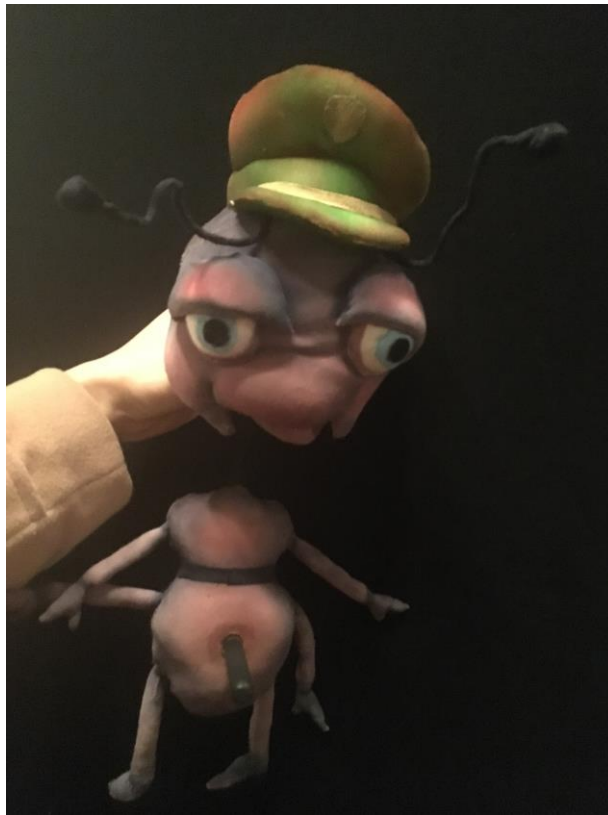
Slika br.3. Mrav, animira ga Petra Cicvarić

zadnji stiiiiiiiiiiiiiiiiiiiiih. 11 Taj zadnji dio čak otpjevam operno, što djecu posebno razveseli i nakon te kratke promjene u ritmu vraćamo se na vojnički strogu pjesmu i akciju spašavanja puža.