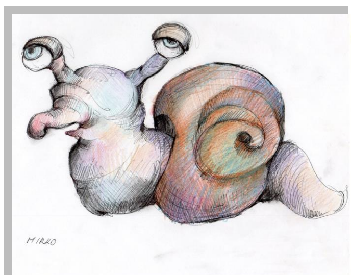
Slika br.1. Prva skica puža Mirka

ono nešto tajanstveno i čarobno što lutke posjeduju. Upravo smo zbog toga odučili da naši puževi ne budu stereotipno mala i spora bića koja se jedva kreću i kojima treba jako dugo da izgovore jednu rečenicu. Nije nam bio cilj pokazati točno kako puž izgleda i kako se ponaša u prirodi. Naši puževi imaju alegorijsko značenje i to je ono što nam je pomoglo u kreaciji lutaka. „Lutkarski teatar najalegoričniji je vid vizualne umjetnosti. Lutka, već samim tim što nije čovjek i uopće nije živo biće već predmet, alegorična je u svojoj suštini.“ 8 , rekao je Sergej Obrazcov. Naši puževi jesu mali, ali imaju izražajne boje koje odgovaraju njihovim karakterima. Oči su svima jako izražene, pogotovo Mirku, glavnom liku, koji je sanjar i koji stalno traži sreću izvan sebe, gore na nebu. Vjeverica ima izražene oči, iako ne vidi ono što joj je pred nosom.