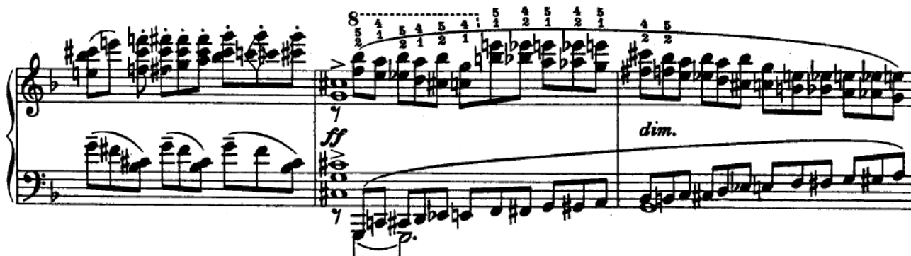
Primjer 10 Etude – tableaux op. 39 br. 8