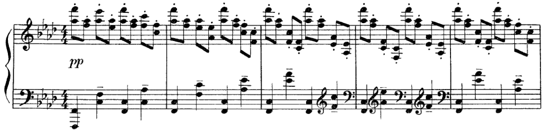
Primjer 1 Etude – tableaux op. 33 br. 1

Kao tipičan primjer Dies irae napjeva u oba ciklusa etida možemo navesti primjer sa kraja Etide op. 33 br. 1 u f – molu u kojoj se u gornjem glasu desne ruke čuje tema od četiri tona jedinstvena za navedeni napjev.