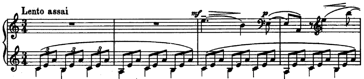
Primjer 2 Etida op. 39 br. 2

Navedimo kao primjer i Etidu op. 39 br. 2 u a – molu u kojoj već od uvodnih taktova lijeva ruka donosi kretanje četiri tona specifičnih za Dies irae koji zatim postaje ostinato ritam kroz cijelu etidu.