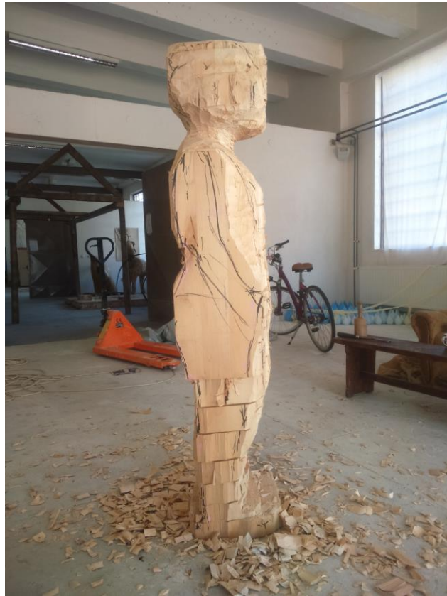
A-fotografija rada u procesu izrade