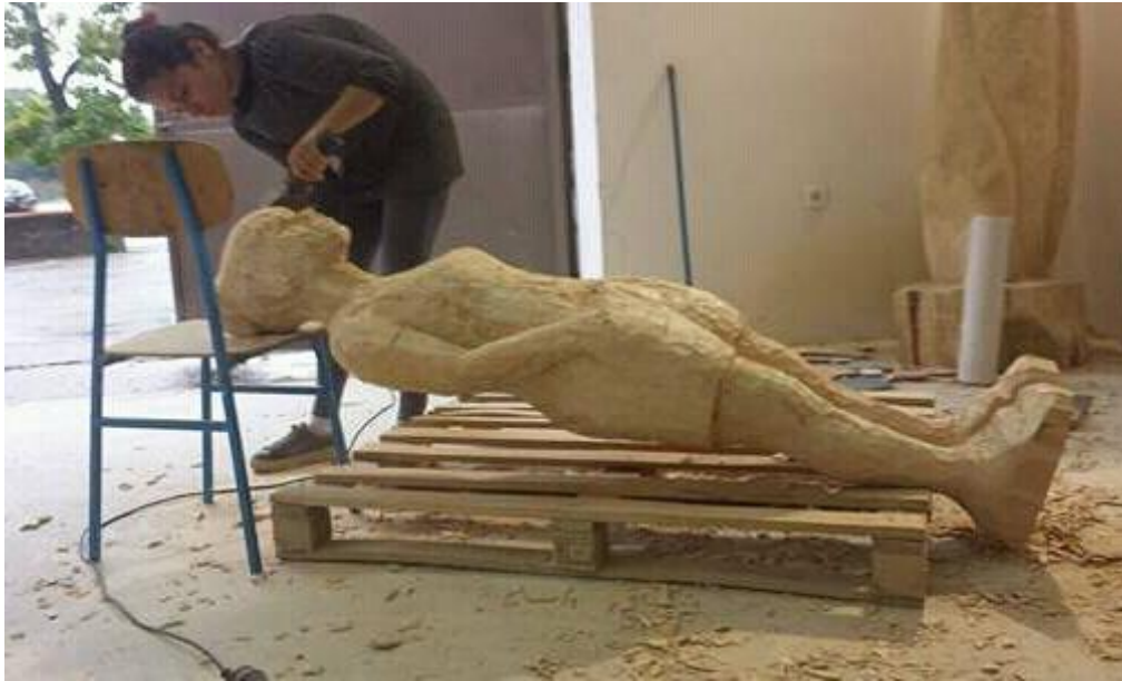
C-fotografija rada u procesu izrade