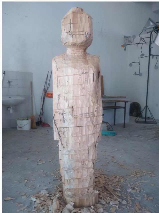
B-fotografija rada u procesu izrade