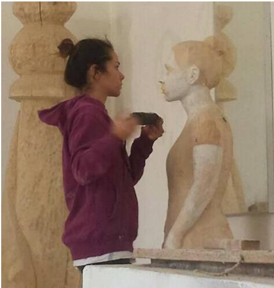
D-fotografija rada u procesu izrade