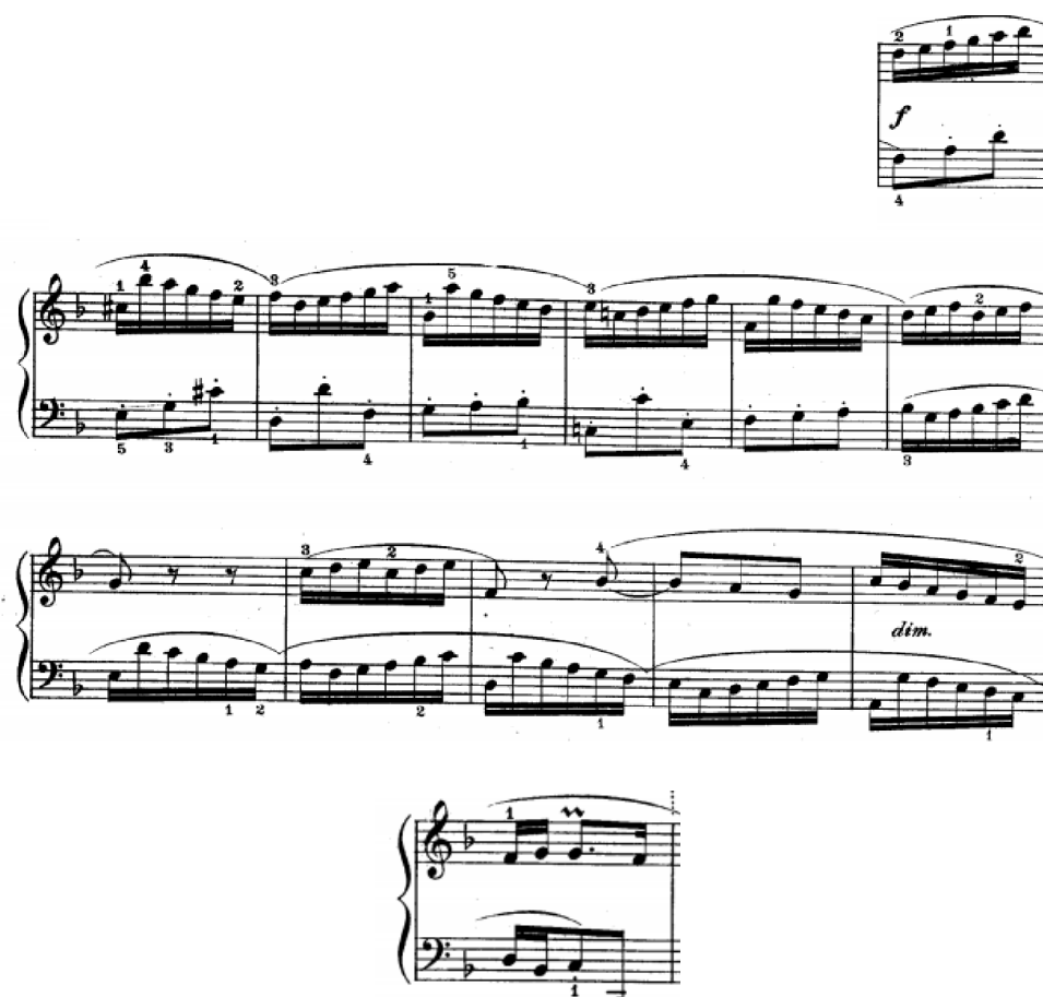
Slika br.11.Prvimeđustavak (5-17 takt)