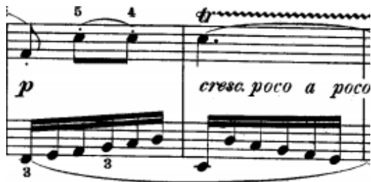
Slikabr.12.-Tema u drugoj provedbi(18-19 takt)

Drugi dio invencije započinje u 18. taktu pojavom teme u paralelnom F-duru u donjem glasu (slika br.12). U gornjem glasu iznosi se kontrapunkt u osminkama što je karakteristično za kontrapunkt u ovoj invenciji.