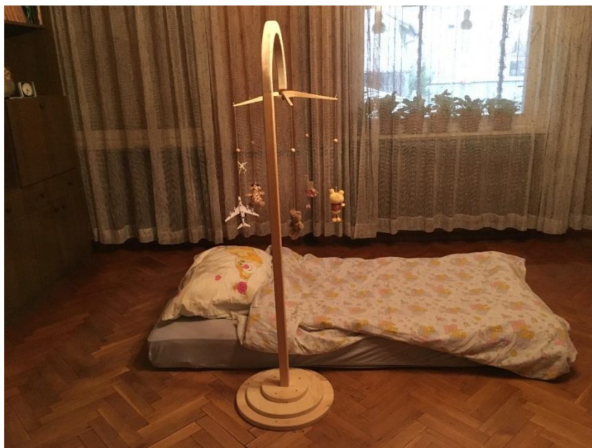
Prilog 4 – Spomenik izgubljenim snovima , radna verzija postava, 2018.g.