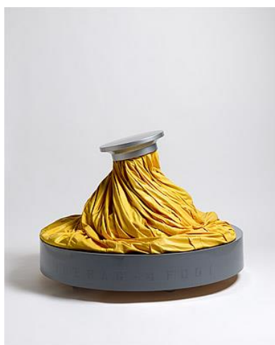
Prilog 8 - Oldenburg, Claes, Ice bag - scale B , 1971.