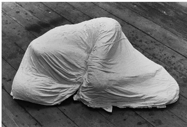
Prilog 3 – Gormley, Antony, Sleeping place , skulptura, 1974. Prema: http://www.antonygormley.com/sculpture/chronology-item-view/id/2186/page/729#p1