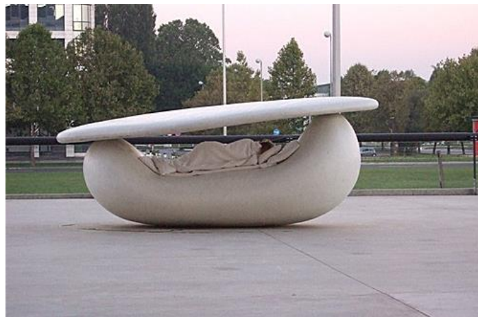
Prilog 2 – Mijatović, Kata, Spavanje između neba i zemlje , performans, 2011. Prema:

Prema: http://www.biennale-design.com/saint-etienne/2015/en/biennial-in/?ev=4-visages-amp-dream-alex-cobas-387