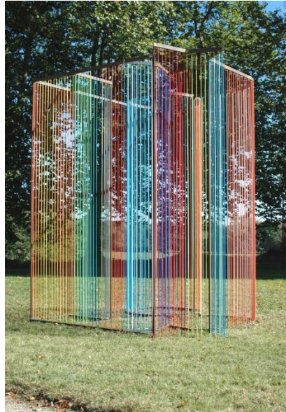
Prilog 1 – Cobas, Alex, Dream 14 , izložba Internacionalno Bijenale Dizajna u Saint-Étienneu, 2015.

Prema: http://www.biennale-design.com/saint-etienne/2015/en/biennial-in/?ev=4-visages-amp-dream-alex-cobas-387