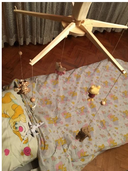
Prilog 7 – Vrtuljak s igračkama