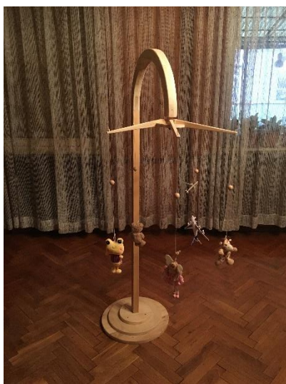
Prilog 6 – Vrtuljak s igračkama