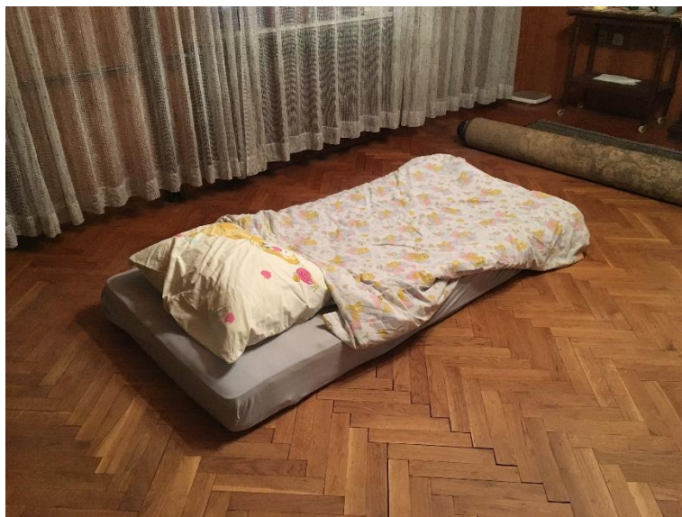
Prilog 5 – Madrac s jastukom i poplunom