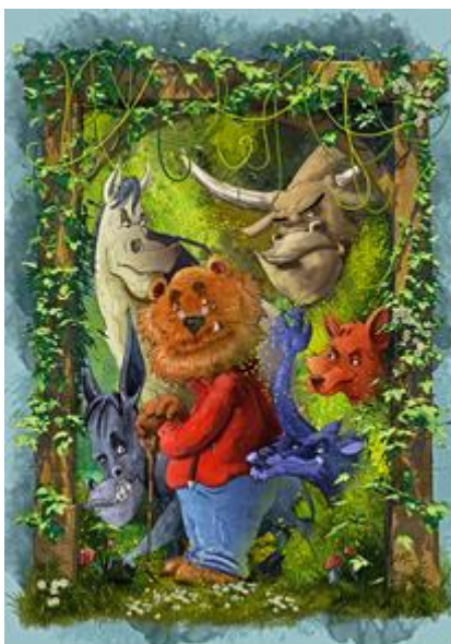
12. Basna „Dosjetljiva lisica“

Ilustracija pokazuje personificirane životinje, a želio sam postići idiličan ugođaj sklada. Okvir ilustracije također slijedi zadanu ideju oponašanja izraza uobičajenih dječjih slikovnica. Iako veličinom manji, stari lav bojom nosi glavni naglasak ilustracije. Životinje se pogledom usmjeravaju uglavnom gledatelju, zovući ga u okvir ispričane basne i prizora, koji izgleda simpatično i bezazleno. Izrazima lica životinje su personificirane u različite tipove ljudskih karaktera