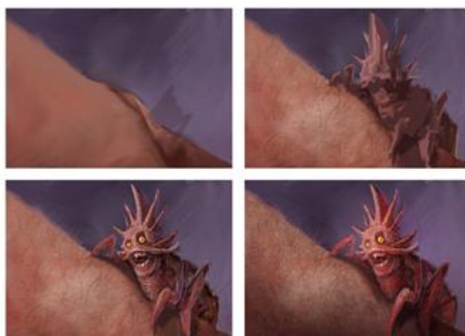
2. Basna „Buha“ -detalj

Prikazana je kako ju taj čovjek vidi u svom pretjerivanju , misleći da mu stvarno treba tuđa pomoć kako bi ju maknuo sa sebe. Ilustracija je odrađena u tehnici digitalnog slikarstva bez intervencije 3D-a, a proces slikanja je klasičan, od velikih cjelina gradio sam prema manjim, do detalja kao što su dlake na koži ruke.