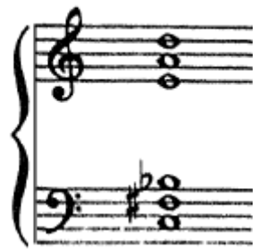
Primjer 1. Skrjabin: „Mistični“ akord

Međutim, Skrjabin sve više razvija svoj individualni stil te počinje graditi harmonije na kvartama, umjesto na tercama. (Danuser, 2007.; Šonberg, 1983.) Tako su mnoge njegove kompozicije građene na tzv. „mističnim“ akordima 4 . (Primjer 1.)