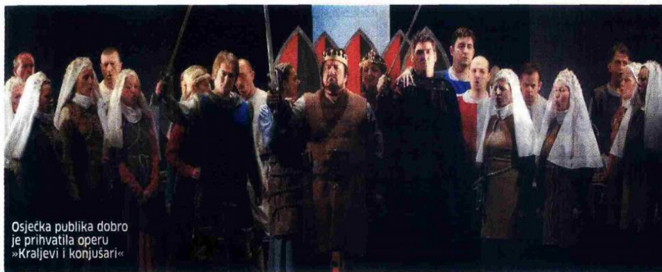
Osječka publika dobro je prihvatila operu »Kraljevi i konjušari«