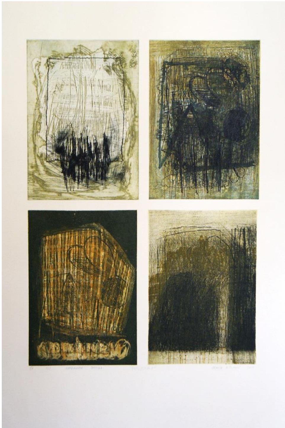
Slika 8. Evolucija II, akvatinta, bakropis, otvoreno jetkanje, uljni pastel, 100x70 cm, 2017.