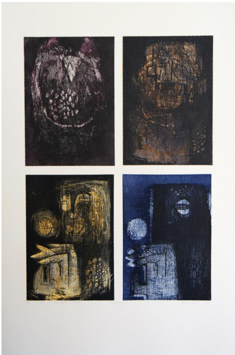
Slika 9. Evolucija III, akvatinta, bakropis, otvoreno jetkanje, uljni pastel, 100x70 cm, 2017.