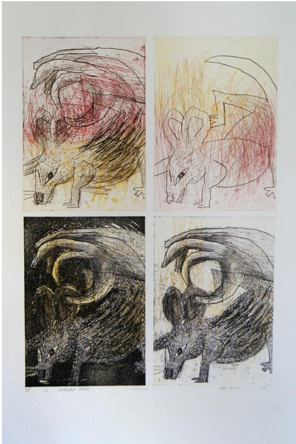
Slika 6. Napredak II, akvatinta, bakropis, otvoreno jetkanje, uljni pastel, 6x68 cm, 2015.