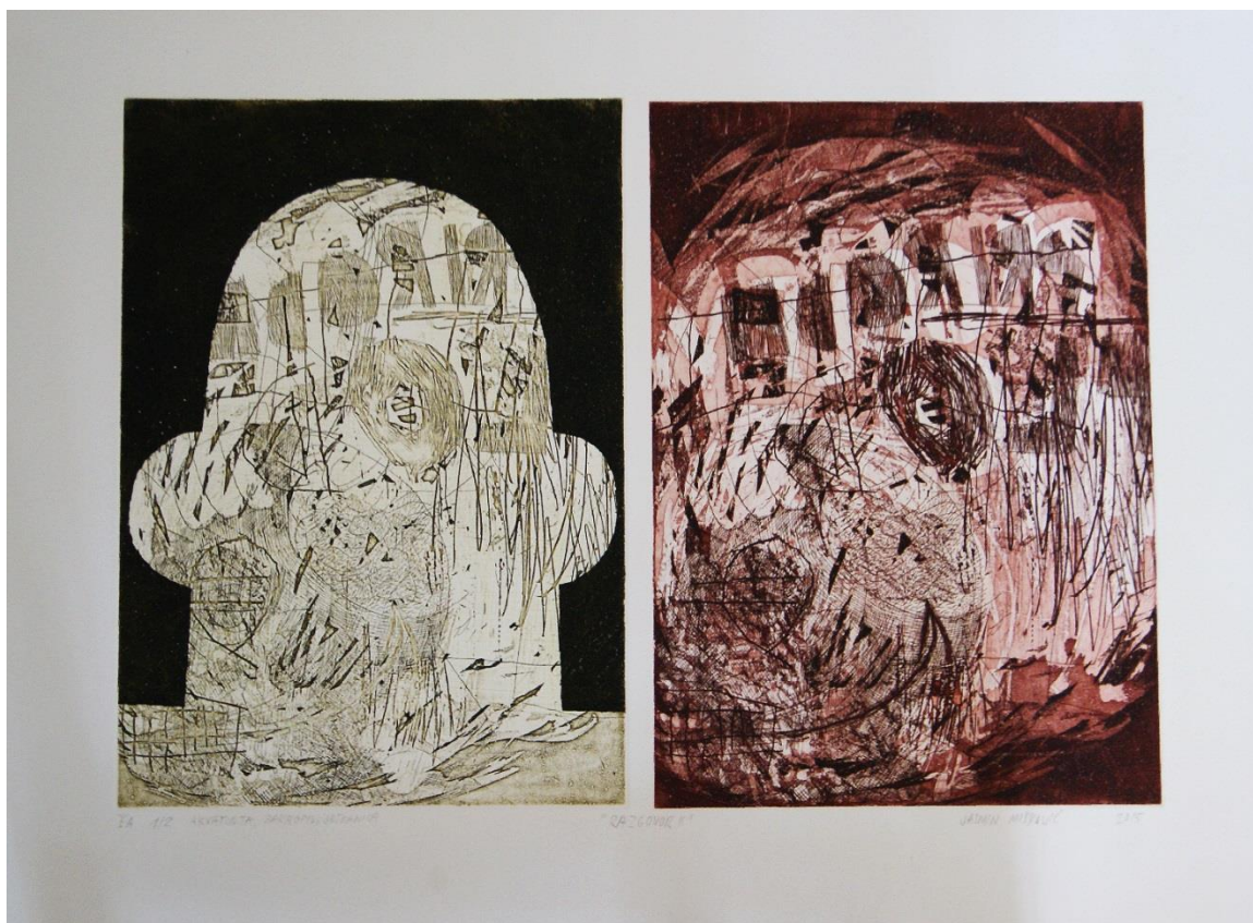
Slika 4. Razgovor II, akvatinta, bakropis, otvoreno jetkanje, uljni pastel, 62x48 cm, 2015.