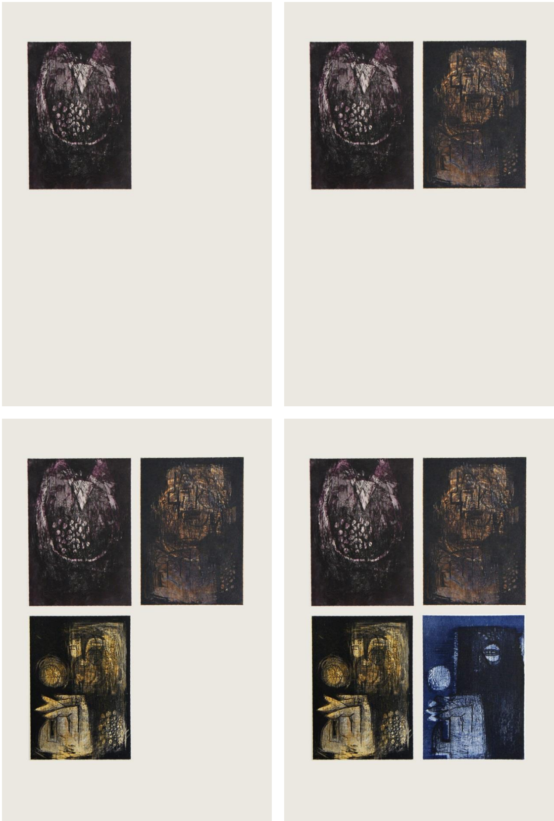
Slika 1. Proces nastajanja grafičkog lista "Evolucija III"