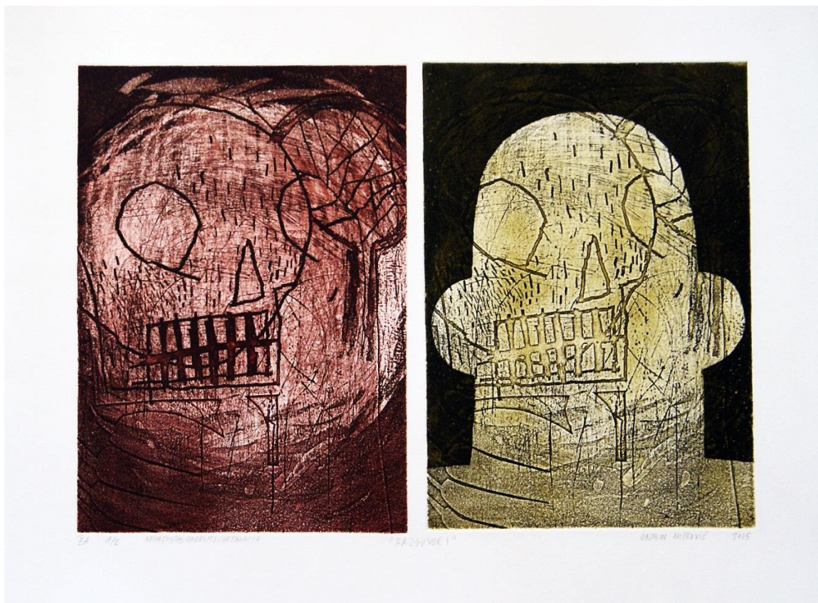
Slika 3. Razgovor I, akvatinta, bakropis, otvoreno jetkanje, uljni pastel, 62x48 cm, 2015.