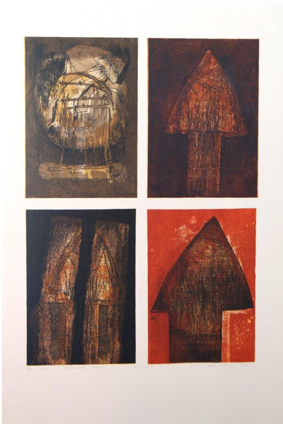
Slika 7. Evolucija I, akvatinta, bakropis, otvoreno jetkanje, uljni pastel, 100x70 cm, 2017.