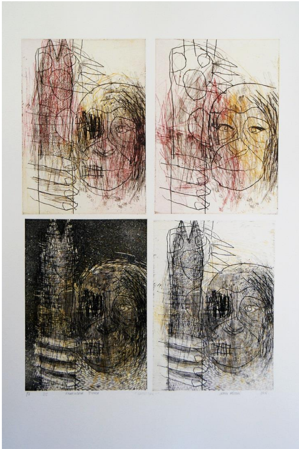
Slika 5. Napredak I, akvatinta, bakropis, otvoreno jetkanje, uljni pastel, 6x68 cm, 2015.