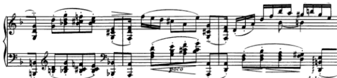
Primjer br. 4; takt 138

Početak srednjeg dijela u D-duru označava emocionalan razvoj skladbe nakon kojeg slijedi tragičan završetak.