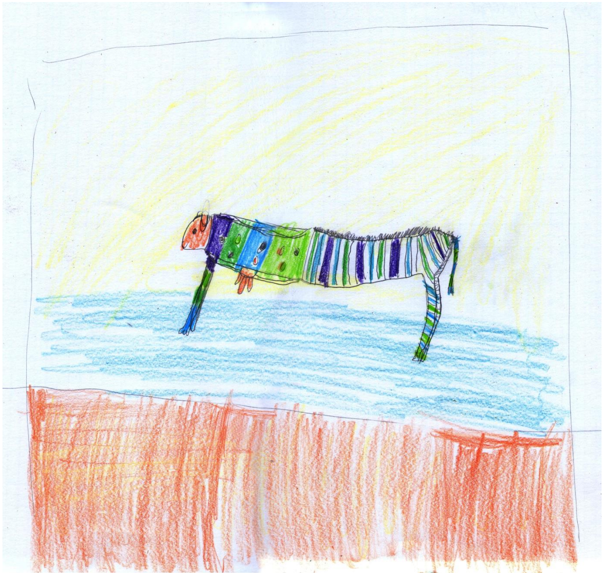
"Morski šar životinja", Dino, 10 godina

Životinje koje je Dino dobio prilikom izvlačenja papirića su zebra, svinja i fazan, a pet boja koje je dobio bacanjem kockice su plava, svjetlozelena, tamnozeleno, ljubičasta i narančasta. Stanište je obala mora. Za svoju kreaturu, Dino je odlučio da ima glavu i prednji dio svinje, a stražnji dio zebre, dok bi za prednji dio svinjskog tijela iskoristio šareno perje koje karakterizira fazana. Dino je pokazao svoju nesigurnost jer nije znao kako upotrijebiti boje koje je izvukao. Potaknula sam ga da razmisli želi li zebrine pruge obojiti u svaku boju koju je dobio ili da iskoristi barem dvije boje, i on se odlučio za ovo potonje. Svinjsku glavu obojio je u narančasto, no dodao joj je i vime nalik kravljem ispod njezinog trupa. Prilikom bojanja, odustao je od doctavanja fazanovih krila, kako je bio inspiriran nakon što je vidio primjere