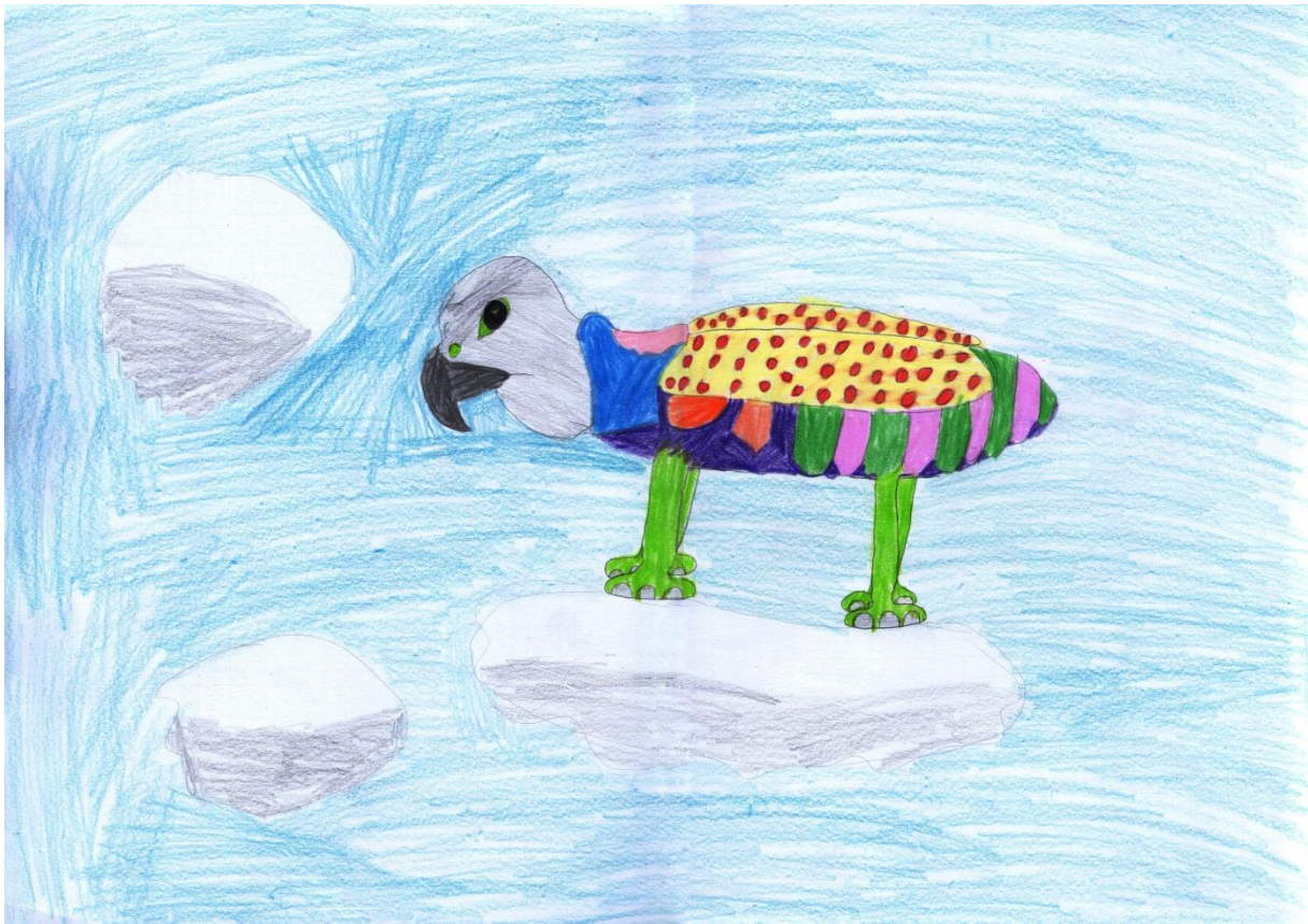
"Četveronožni kljunaš", Gabrijela, 14 godina

Gabrijelino je drugo stvorenje još jedan spoj tri različite životinje. Ono ima glavu sokola, tijelo skakavca, a noge slona. Ta životinja živi na oblacima. Prije nego je počela bojati, pitala me hoće li oblake obojati plavom bojom, na što sam ju upozorila da to ne radi (jedna od šablona u dječjem izražaju je taj da su oblaci plavi, a nebo bijelo), nego da oblake ostavi bijelima, ali da sa sivom bojom naznači sjenu tih oblaka, a nebo oboji plavom bojom. Četveronožni kljunaš , naziv je njezinog stvora, inspiriran slikama grifona.