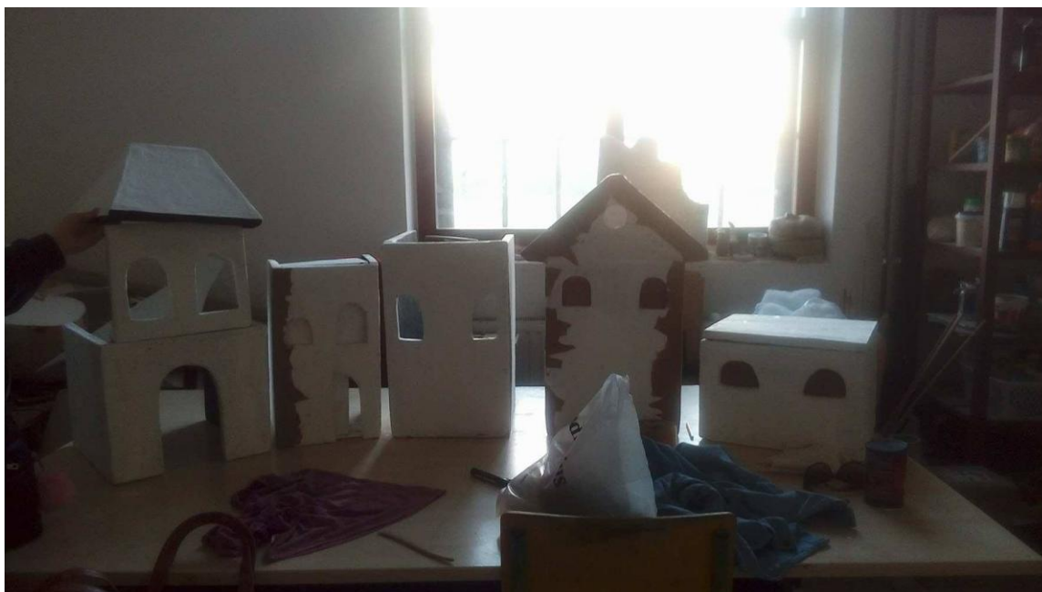
Slika I. Spojeni i prekaširani zidovi kuća

Zatim kreće najzahtjevniji posao – mehanizmi. Na samom početku projekta, ideja je bila da Milivoj, Mila i Sofija imaju neki sebi karakterističan pokret i način animacije. Daljnjim radom i u dogovoru s kolegicama, to se promijenilo. Tako sam svakoj kući osmislila nekoliko različitih pokreta karakterističnih za njihov lik, što će im još više dati na živosti. Također, još jedna promjena nastala u procesu rada bila je dodjeljivanje zajedničkog, istog mehanizma svakoj kući – gledanje i treptanje kroz njezine prozore/oči. Na taj način stvorio se koncept povezanosti između svih kuća. To je najuočljivije u prvoj slici. Kuće na početku spavaju sve dok njihovi stanari ne započnu s radnim danom i pođu od svojih domova zbog dnevnih obaveza. Kada ih stanari napuste, one se bude, otvaraju oči i komuniciraju njima, započinju svoj život.