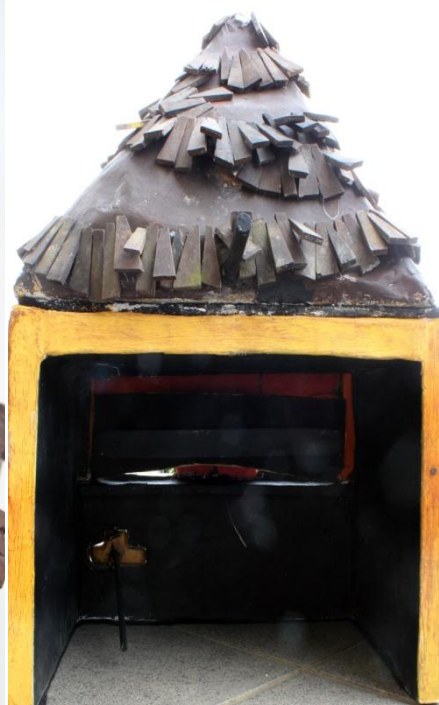
Slika XVI. Milivoj stražnji dio, mehanizmi