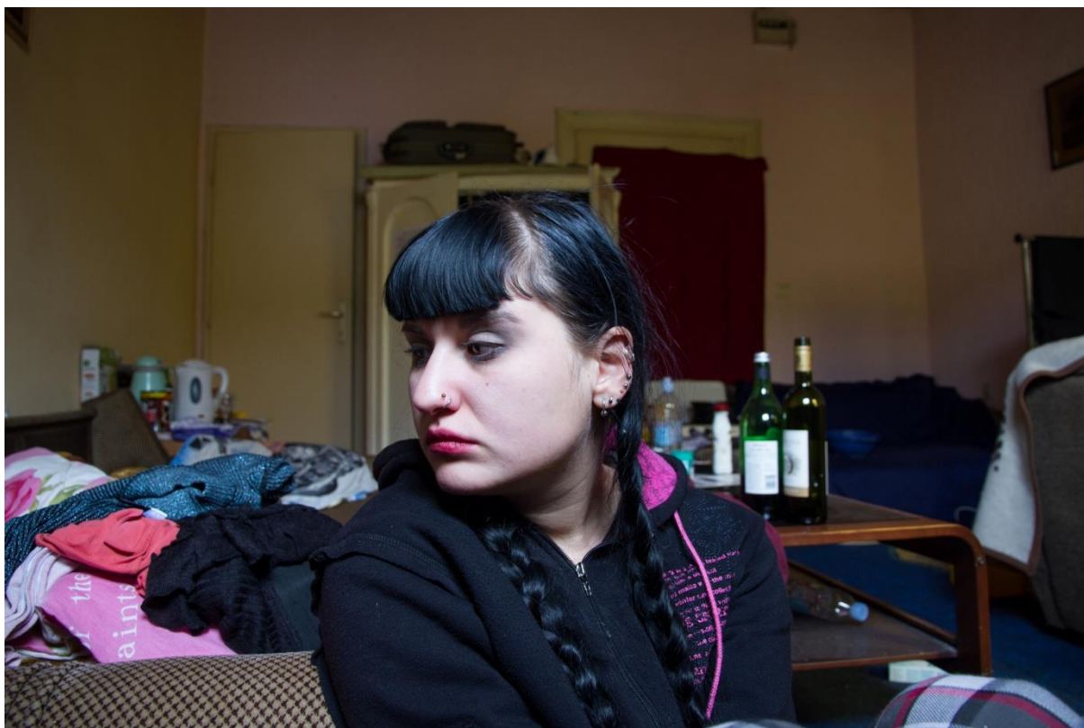
Apart ment (2016.)

Serijska fotografija Apart ment , osim što se nadovezuje na pitanje prikazivanja ženske seksualnosti, ispituje i različite razine autorepresentacije i njene vjerodostojnosti. Nedvojbeno je da ljude ne možemo gledati u izolaciji, kao jedan entitet, mi smo društvena bića koja su smještena u društveni kontekst. Stoga u našem doživljaju samih sebe, ključnu ulogu imaju drugi ljudi. Sama mogućnost prisutnosti druge osobe čini to da sebe vidimo kao predmet i da naš svijet vidimo onako kako izgleda drugima. Ako govorimo o autorepresentaciji, mi zamišljamo ono što bi drugi ljudi mogli vidjeti kada nas pogledaju i onda se konformiramo tim slikama. Ljudi imitiraju sliku koju misle da drugi vide. To su ideje koje imamo o tome tko smo koje vode naše razmišljanje i ponašanje. Tijekom vremena se mijenjaju, kako se mijenjaju naši ciljevi, ali te ideje su statične u smislu da su to slike na koje se referiramo a ne aktivni procesi. Autorepresentacija se sastoji od mnogo toga, no mislim da je važna za umjetnika kako bi se upoznao ili čak stvorio novog sebe.