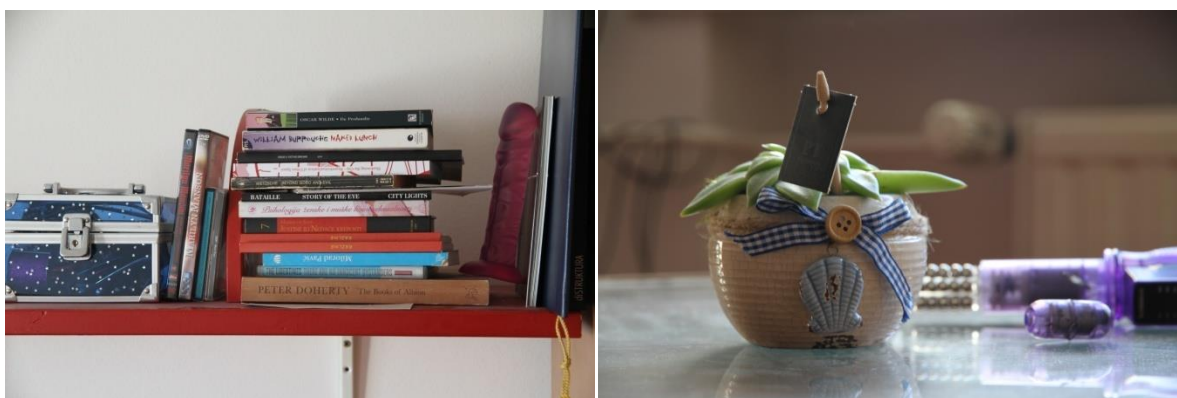
Apart ment (2016.)

Postoje i razne zablude da žene nemaju jak seksualni nagon kao muškarci i da ih se treba moliti ili nagovarati na seks. To je naravno apsolutno netočno ali postoje razlozi zašto kod mnogih žena to tako izgleda. Žena koja nije opuštena i koja je naučena da ne iskazuje svoje seksualne potrebe nikada neće napraviti prvi korak i dozvolit će muškarcu da odlučuje o tome. Smatra se ne primjerenim da žena traži bilo kakav užitak. Žene koje jesu dovoljno slobodne i imaju kontrolu nad svojim seksualnim životom se smatraju promiskuitetnima i bivaju marginalizirane.