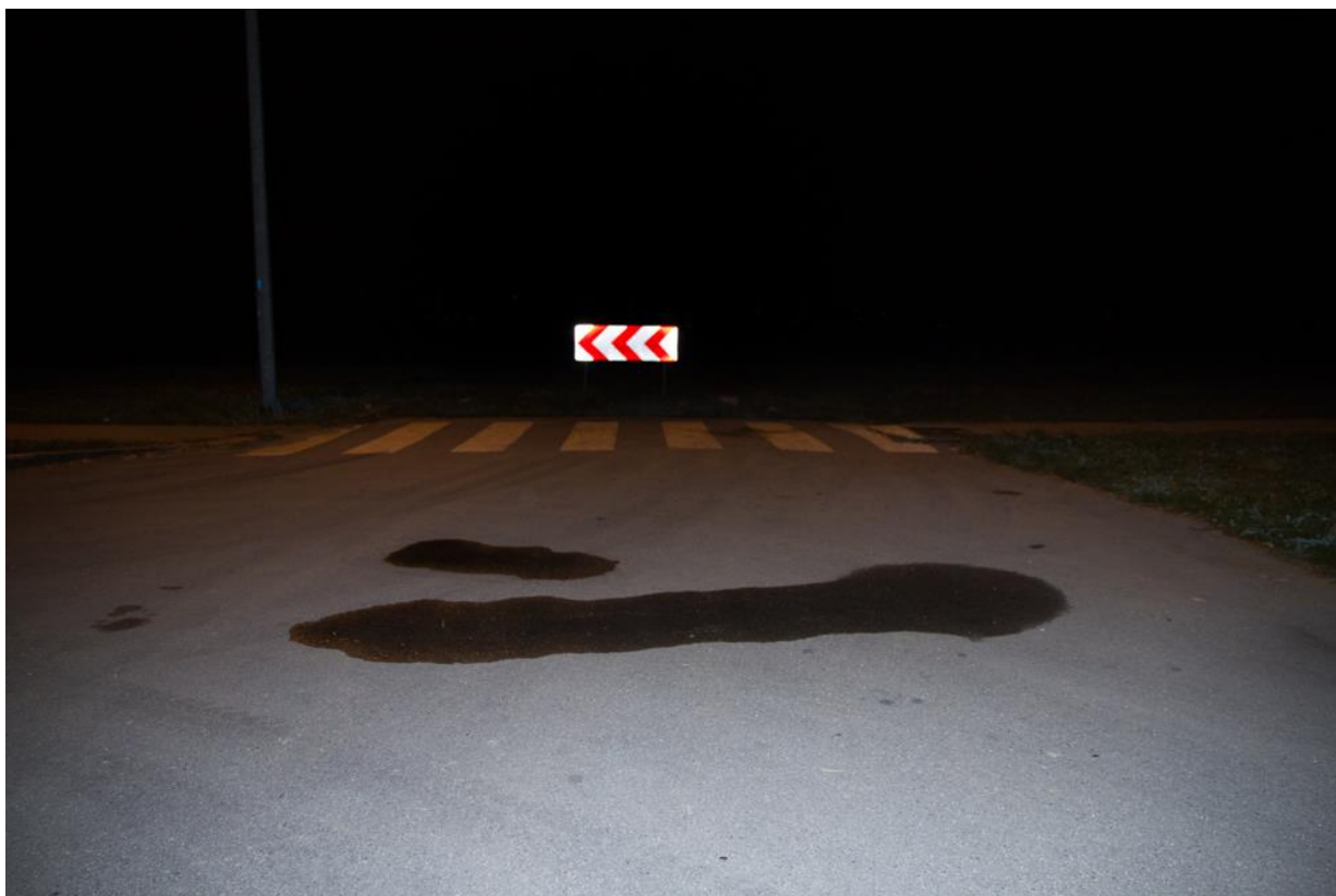
Liquid Transendence (work in progress)

Zbog svih tih društvenih normi koje pokušavaju ograničiti naše slobode ili nas usmjeriti prema određenim načinima ponašanja koji su društveno prihvatljivi, javlja se određeni bunt i snažan nagon za iskazivanje nezadovoljstva. On može biti pobuna, protest ili kritika, ali svrha mu je ukazati na sve ono što ne nevalja i ne funkcioniira dobro u svijetu u kojem živimo. Umjetnice i umjetnici imaju posebnu odgovornost kako bi konstantno ukazivali na sve te probleme, a možda i ponudili rješenja za njih.