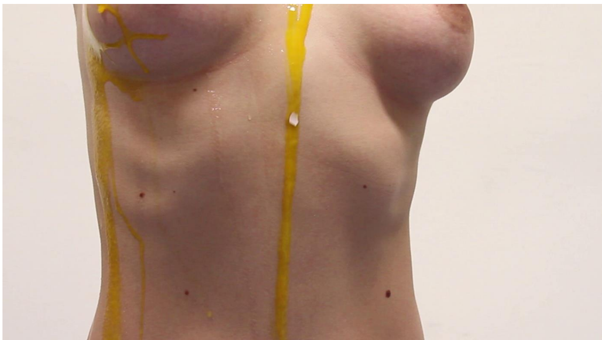
Story of the „I“ (2016.)

U video radu Story of the „I“ se bavim tim pitanja ženske seksualnosti. Korištenjem elemenata performansa i fetišizma koji seksualni fokus stavlja na ne živi predmet i predstavlja opsesivnu pozornost i obožavanje, stvara se fantazija koja je isprepletana sa snovima i fikcijom. Stvaraju se druge stvarnosti koje su međusobno isprepletene. Kroz literarne reference kao što je Story of the Eye Georges-a Bataille-a, koristim simbolički objekt jajeta kao fetišistički predmet koji putem performativnog čina postaje simbol želja i fantazija koje su često skrivene i potisnute. Na taj način, objekti koji se tradicionalno ne smatraju seksualnim, postaju predmeti moći i želje u kontekstu fantazije.