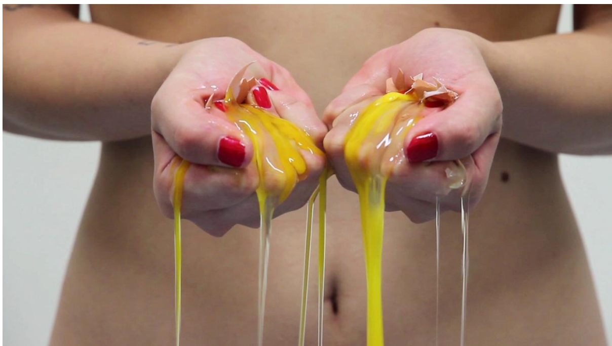
Story of the „I“ (2016.)

Prikazivanje vlastitog tijela kod umjetnica suprotstavljeno je stereotipnom idealu ženskog akta, koji je univerzalna metafora muške želje, moći, i društvene kontrole. Tako kroz pozicije modela žene ulaze u javni prostor, kao figure izložene muškom pogledu. Taj koncept reprezentacije ženskog tijela naša tradicija prikazuje fiksnim i uokvirenim. Na razini prikazivanja, umjetnice su se suprotstavljale stereotipizaciji žena kao objekata u kulturi, razotkrivajući i kritizirajući strukture gledanja koje su je podržavale. Tako je predstavljanje ženske seksualnosti u radovima umjetnica postalo jedan od ključnih elemenata pri nalaženju novih strategija u reprezentaciji žene, koje se opiralo objektivizaciji kao normi u produkciji umjetničkih djela.