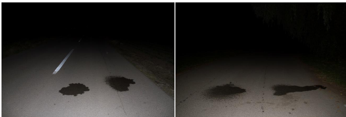
Liquid Transendence (work in progress)

Zbog svih tih društvenih normi koje pokušavaju ograničiti naše slobode ili nas usmjeriti prema određenim načinima ponašanja koji su društveno prihvatljivi, javlja se određeni bunt i snažan nagon za iskazivanje nezadovoljstva. On može biti pobuna, protest ili kritika, ali svrha mu je ukazati na sve ono što ne nevalja i ne funkcioniira dobro u svijetu u kojem živimo. Umjetnice i umjetnici imaju posebnu odgovornost kako bi konstantno ukazivali na sve te probleme, a možda i ponudili rješenja za njih.