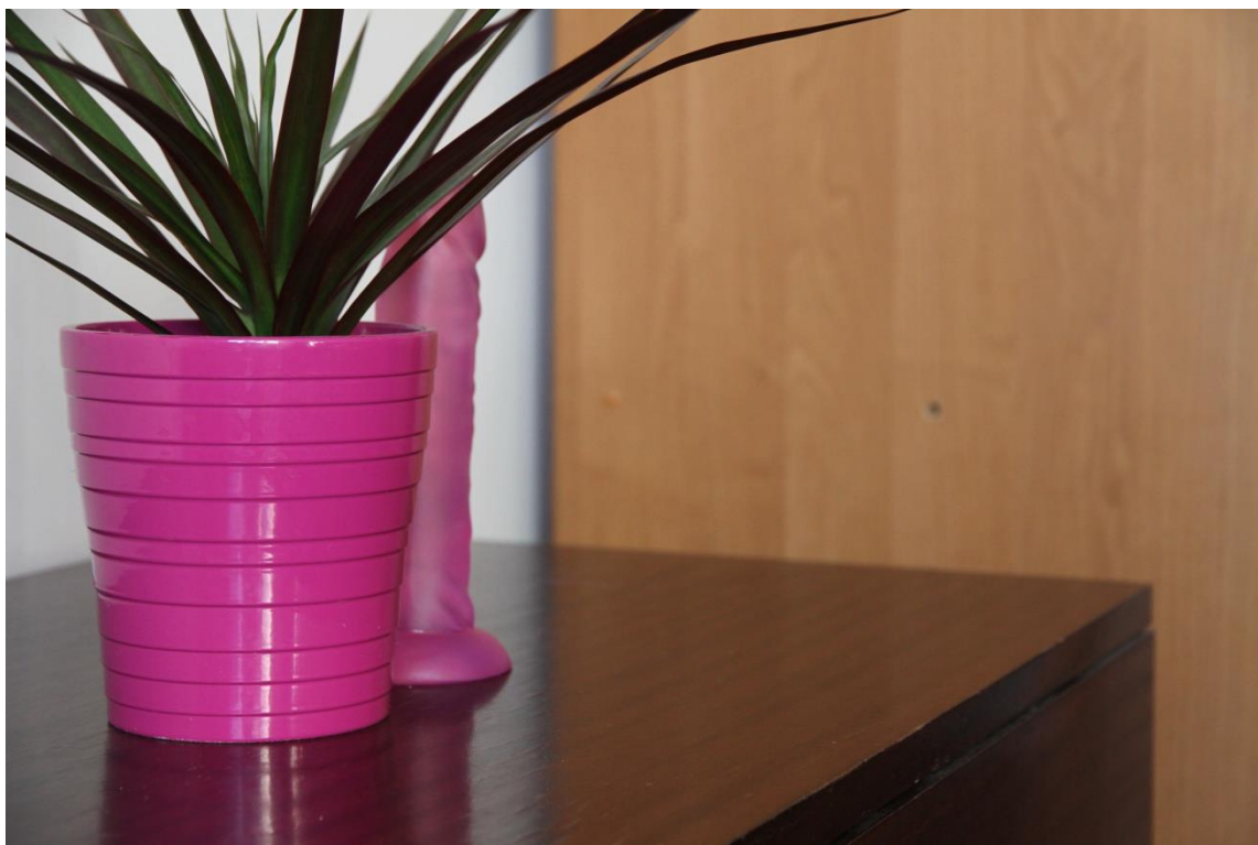
Apart ment (2016.)

Postoje i razne zablude da žene nemaju jak seksualni nagon kao muškarci i da ih se treba moliti ili nagovarati na seks. To je naravno apsolutno netočno ali postoje razlozi zašto kod mnogih žena to tako izgleda. Žena koja nije opuštena i koja je naučena da ne iskazuje svoje seksualne potrebe nikada neće napraviti prvi korak i dozvolit će muškarcu da odlučuje o tome. Smatra se ne primjerenim da žena traži bilo kakav užitak. Žene koje jesu dovoljno slobodne i imaju kontrolu nad svojim seksualnim životom se smatraju promiskuitetnima i bivaju marginalizirane.