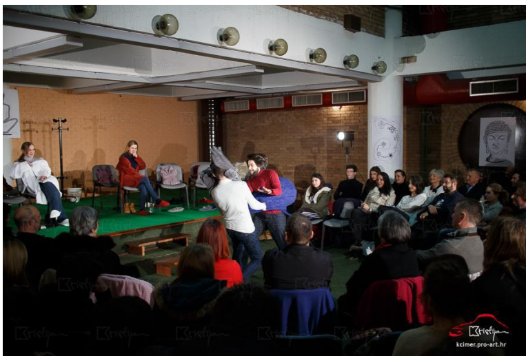
Slika 2: prostor sale za konferencije organiziran i uređen za potrebe predstave po uzoru na antička kazališta i grupe podrške. Na zidovima vidljive slike, središnji dio i povišeni dio namijenjeni za glumačku igru.

U arhitekturu takvog pozorišta moraće se, naravno, uneti neznatne izmene shodno zahtevima naših dana, ali upravo antičko pozorište, s njegovom jednostavnošću i amfiteatralnim prostorom sa publikom, sa njegovim orkestrom – i jeste jedino pozorište koje je sposobno da prihvati željenu raznovrsnost repertoara. 5