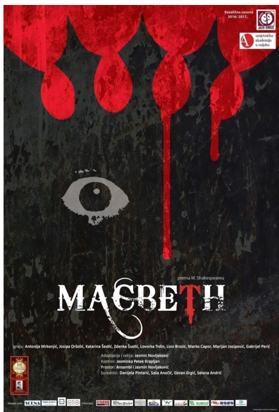
Slika 29 – Plakat predstave

Naučila sam da u dramskom kazalištu postoje čvrste zakonitosti dramaturgije i da odstupanje od njih može dovesti do efektnih, ali potpuno promašenih rješenja. Izuzetno sam zadovoljna što sam imala mogućnost sudjelovati u ovako složenom radnom procesu i nadam se da je moj rad pomogao cjelokupnom uspjehu predstave.