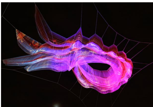
Slika 3, Janet Echelman, skulptura od mreže

Umjetnica koja lance koristi na sličan, ali puno kompleksniji način je Janet Echelman. Svoje instalacije golemih dimenzija sastavljene od nizova lanaca često postavlja u urbanim eksterijerima, razapete između zgrada. Dojam fluidnosti i lebdjenja koji postiže dodatno je naglašen jakim koloritom. Njeni razigrani i vedri radovi u suprotnosti su sa mojima; počevši od toga da ja koristim izvorne boje materijala odnosno željeza koje metaforički najbolje prikazuje surovost mog života koji me uistinu nije mazio, pa do same jednostavnosti izvedbe koja sugerira osobne traumatične procese. (slika 3.)