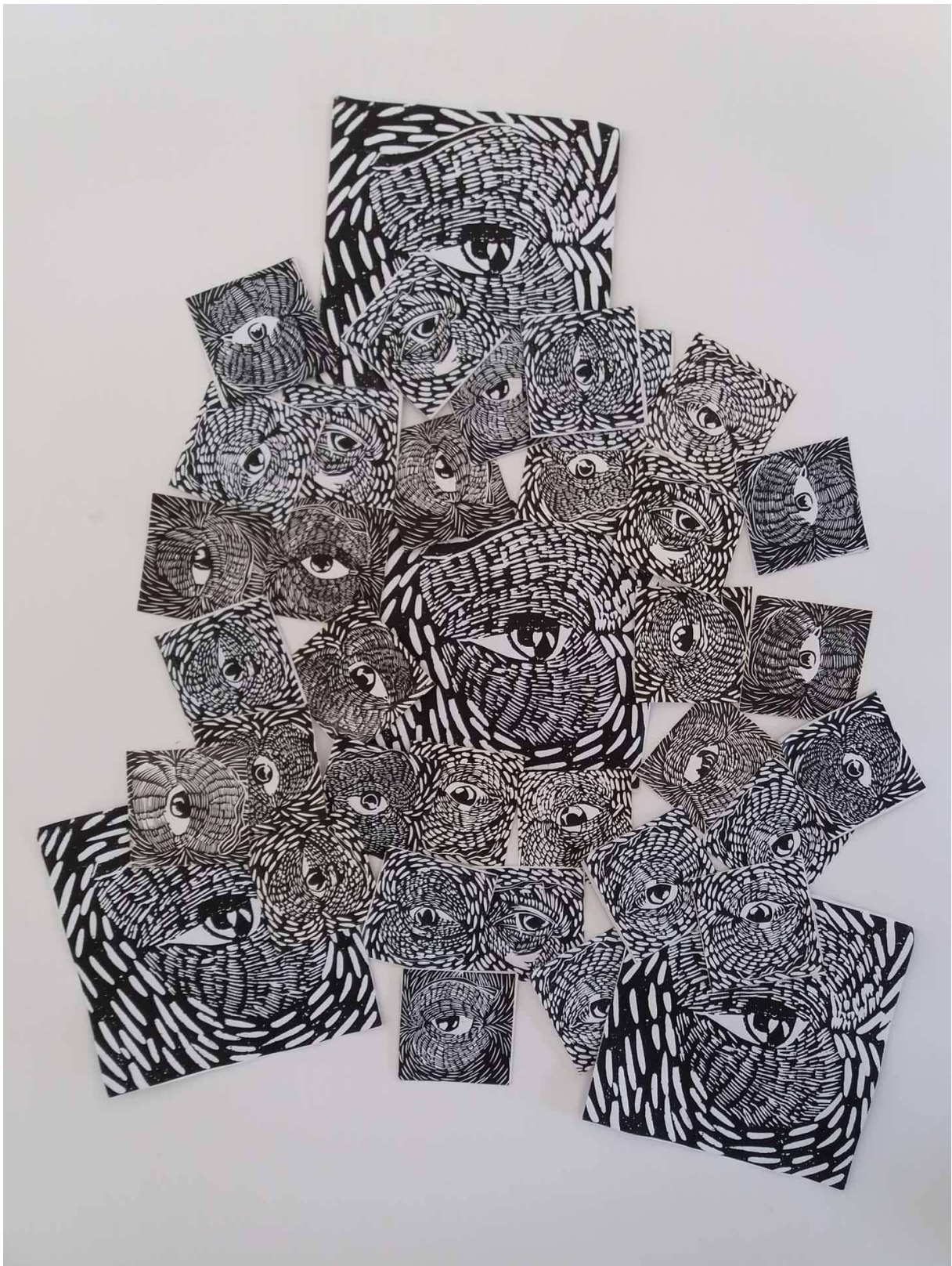
Slika 8, Senka Banjac, Oči , fotokopije