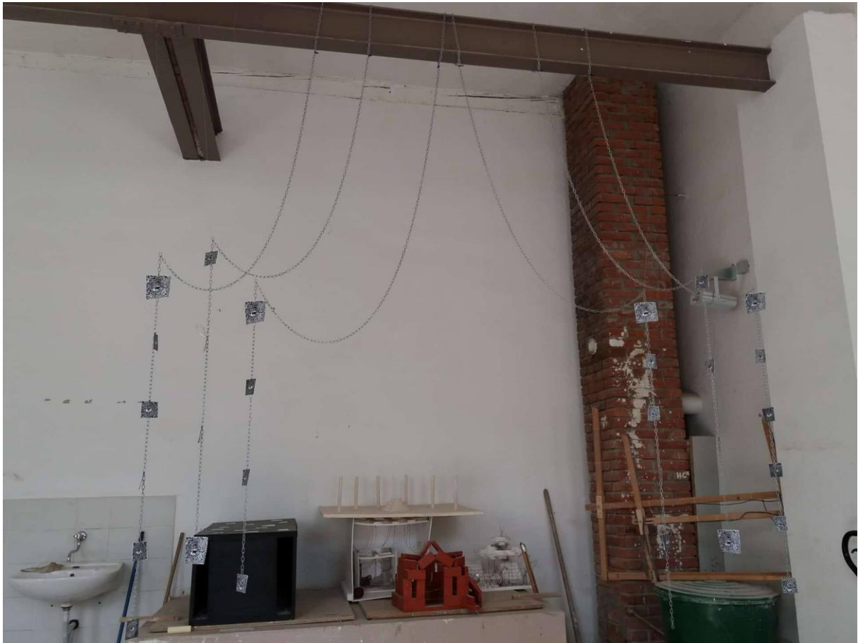
Slika 7, Senka Banjac, Lomljenje identiteta