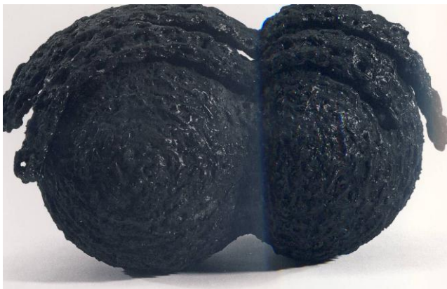
Slika 1, Dušan Džamonja, F-IX , 1993.

„Kao treći ready made pojavit će se u Džamonjinoj skulpturi šezdesetih i lanci i time će istraživački lanac biti zatvoren i posljednja karika salivena. Lanac je također struktura mikroorganizma koji grade i izgrađuju velike forme : osnovna karika u tom procesu (u doslovnom i prenesenom smislu riječi) elipsoidna je omča koje se mijenjajući usmjerenje (vodoravno-okomito) spaja u niz, postaje lancem, kao što od niza točaka nastaje linija. No, ako ih se, unatoč tankoći pojedinoga naniže jedan do drugoga u dovoljnoj mjeri (kvantitet-kvalitet), postaju plohom, što se može oblikovati po zamisli stvaratelja : u valovitu prostirku ili zavjesu, oblikovati valjkaste ili kuglaste, gomoljaste ili bilo kakve druge oblike, ostavljati otvore i šupljine, stvarajući živu strukturu površine, poroznu i šupljikavu, sitno reljefnu, nemirnu u svjetlosti i sjeni što se igra na sitnome reljefu karike (često zataljene) i na na kontrastu metala i šupljine.“ 5 (Slika 1., slika 2.)