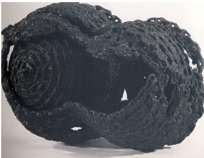
Slika 2, Dušan Džamonja, F-X , 1993.

Umjetnica koja lance koristi na sličan, ali puno kompleksniji način je Janet Echelman. Svoje instalacije golemih dimenzija sastavljene od nizova lanaca često postavlja u urbanim eksterijerima, razapete između zgrada. Dojam fluidnosti i lebdjenja koji postiže dodatno je naglašen jakim koloritom. Njeni razigrani i vedri radovi u suprotnosti su sa mojima; počevši od toga da ja koristim izvorne boje materijala odnosno željeza koje metaforički najbolje prikazuje surovost mog života koji me uistinu nije mazio, pa do same jednostavnosti izvedbe koja sugerira osobne traumatične procese. (slika 3.)