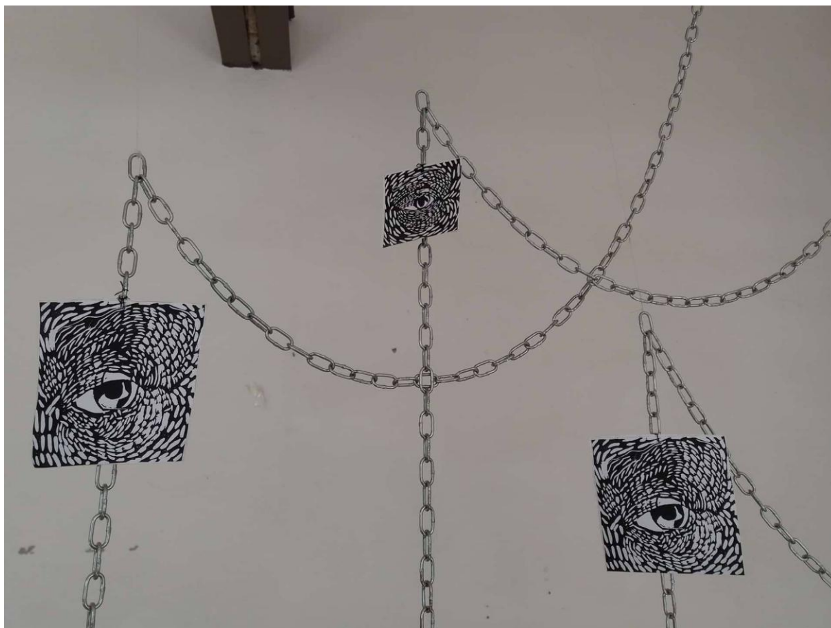
Slika 5, Senka Banjac, Lomljenje identiteta , detalj