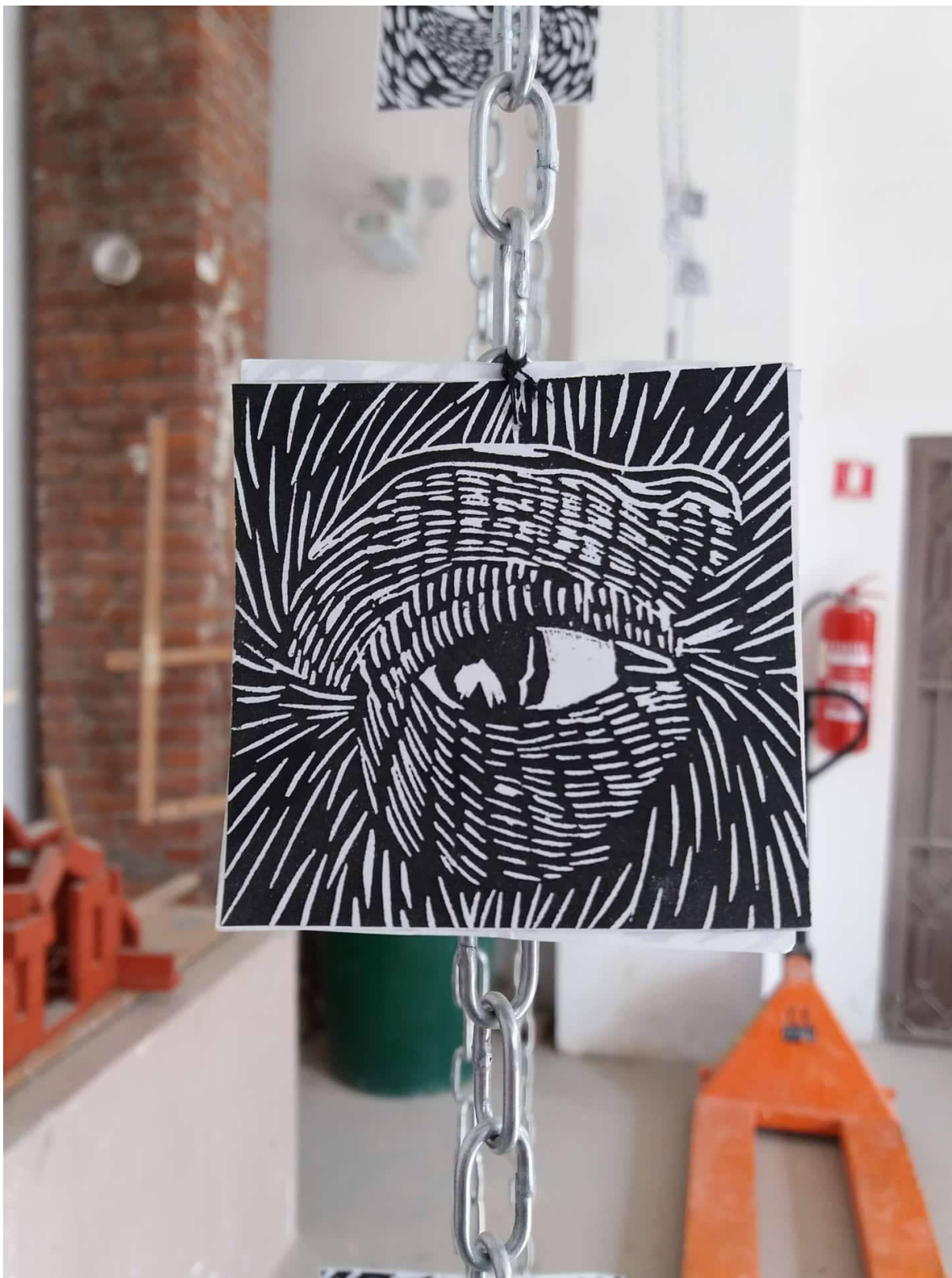
Slika 6, Senka Banjac, Lomljenje identiteta , detalj