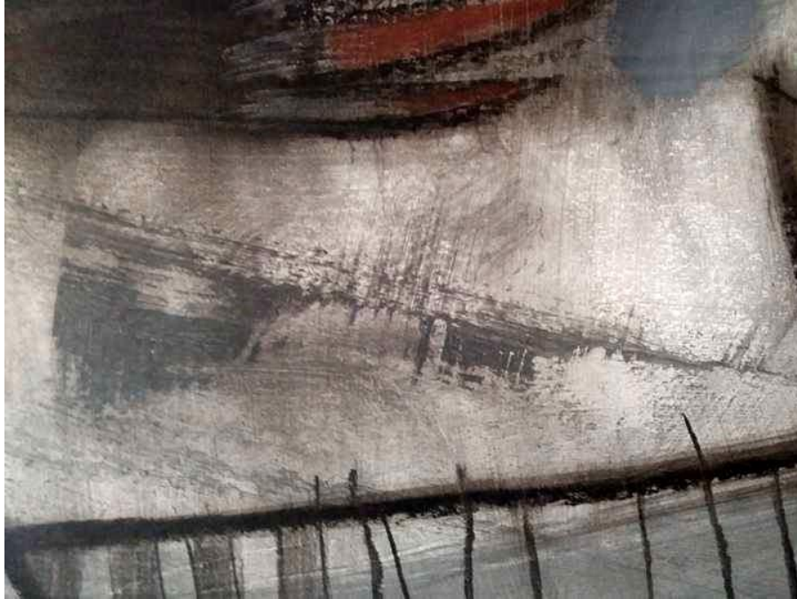
„ detalj slike br.1 „