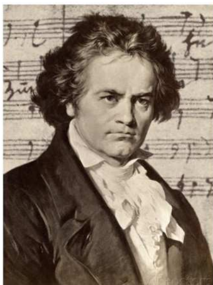
Slika br. 1- Ludwig van Beethoven

Ludwig van Beethoven rođen je 1770. godine u Bonnu. Beethoven označava kraj klasike, proširujući stil Haydna i Mozarta u pogledu trajanja skladbi, emocija i dinamičnosti. Kako je prethodno već navedeno, Beethoven se rodio 17. prosinca 1770. godine u njemačkom gradu Bonnu, na rijeci Rajni. Od najranijeg djetinjstva prima poduke od svog oca učeći klavir i violinu. To su za njega bila teška razdoblja jer je otac od njega želio stvoriti „glazbeno čudo“. Budući da mu otac nije mogao dati nikakvu metodičku poduku, šalje ga na podučavanje gradskom orguljašu Wilibaldu Kochu. Njegovim prvim pravim učiteljem 1781. postaje Christian Gottlob koji je u njemu vidio velik, ali skriven talent. Već 1782. Beethoven kao trinaestogodišnjak zamjenjuje svog učitelja na mjestu dvorskog orguljaša, a nakon što je primio poduku od koncertnog majstora postavljen je na mjesto dvorskog korepetitora. Nakon što mu majka umire, i zbog očeva alkoholizma, Beethoven je primoran preuzeti odgovornost za cijelu svoju obitelj. 1790. godine podučava ga Joseph Haydn, ali i mnogi drugi: Johann Schenk, Antonio Salieri, Johann Georg Albrechtsberger,... U to vrijeme nastaju i nove rane skladbe, no tu se radilo o manjim sonatama i skicama. Živi od honorara koji prima kao učitelj klavira. 29. ožujka 1795. godine nastupa, po prvi puta, u gradskom kazalištu te predstavlja bečkoj javnosti svoj prvi klavirski koncert u