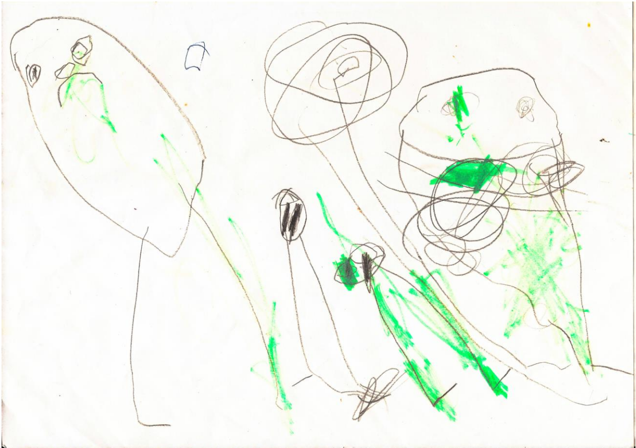
Prilog 5: Crtež djeteta od 3 godine, „Obitelj“