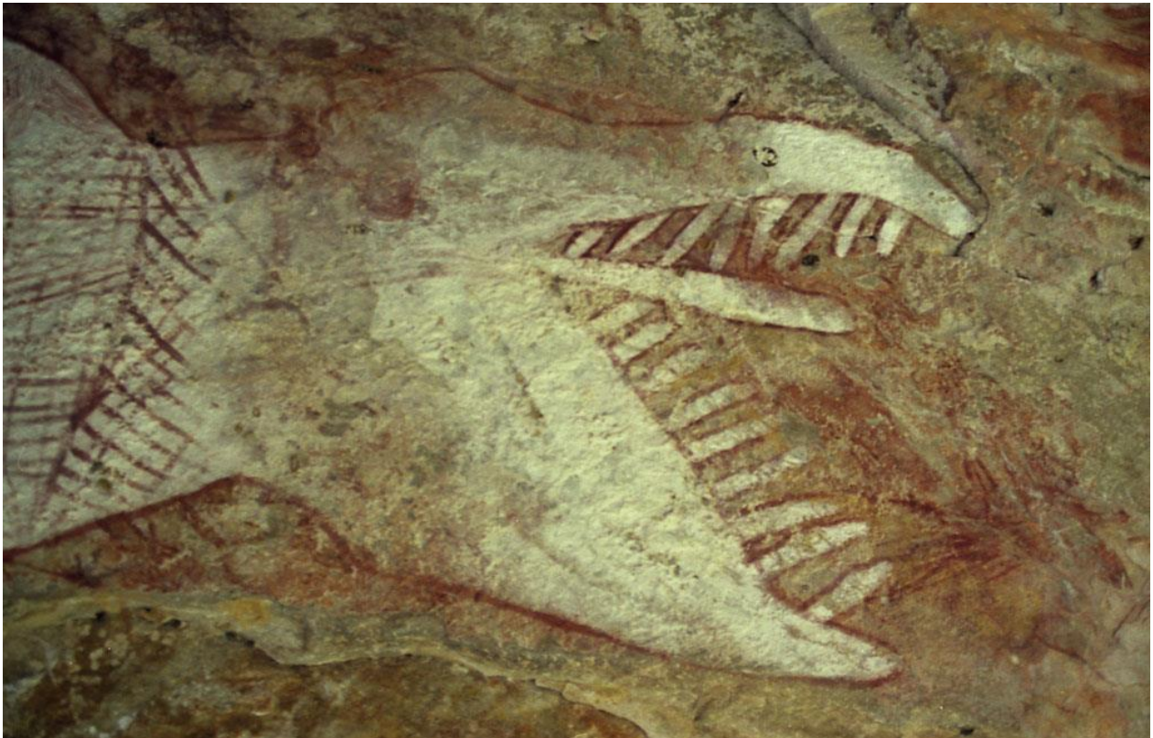
Prilog1: Aboridžinsko slikarstvo na stijenama