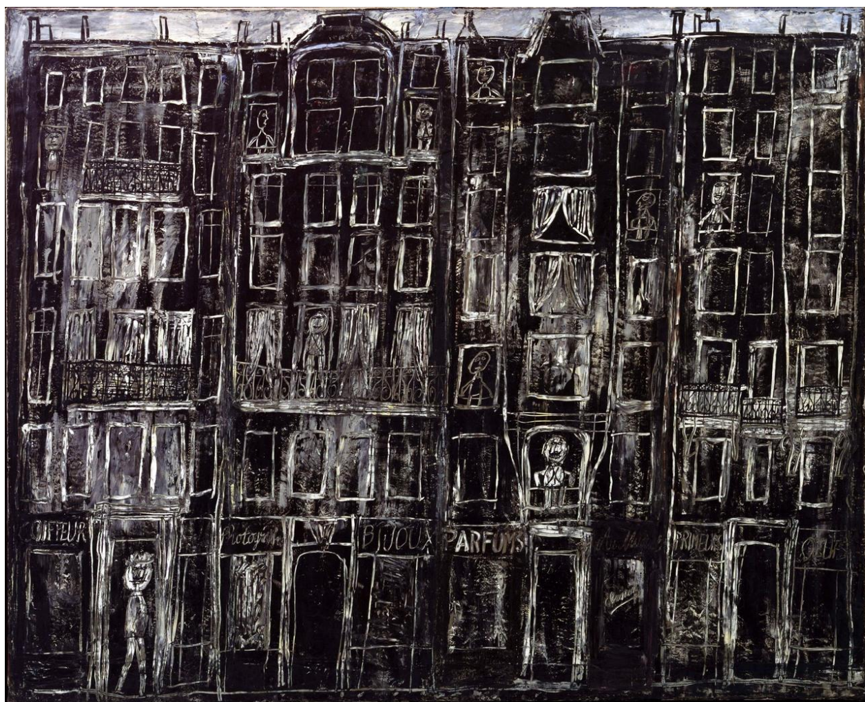
Prilog3: Jean Dubuffet „Fasada zgrade“