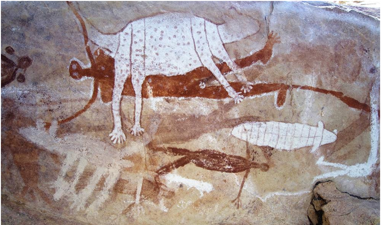
Prilog 2: Aboridžinsko slikarstvo na stijenama