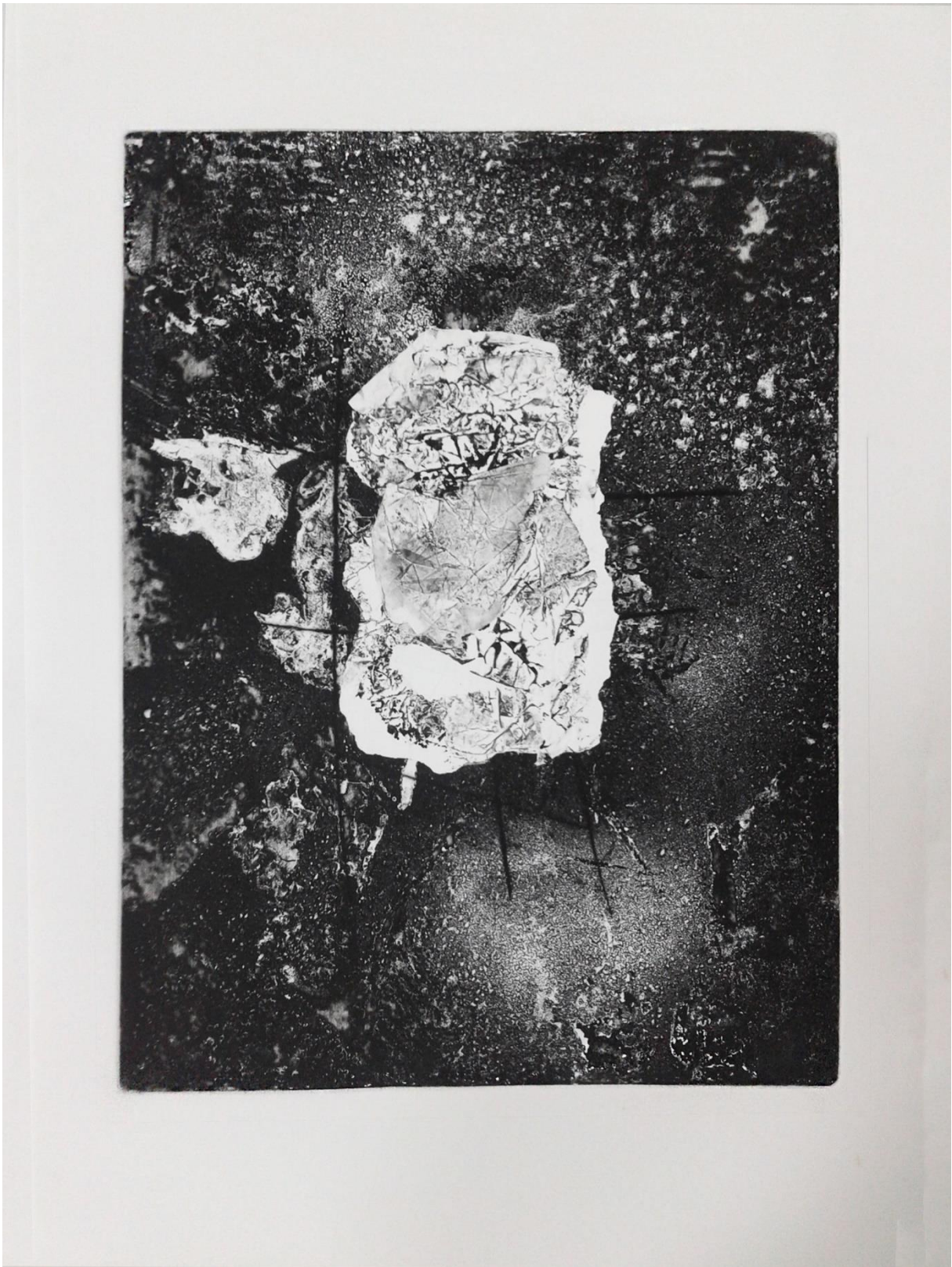
Prilog 6. - Peti rad