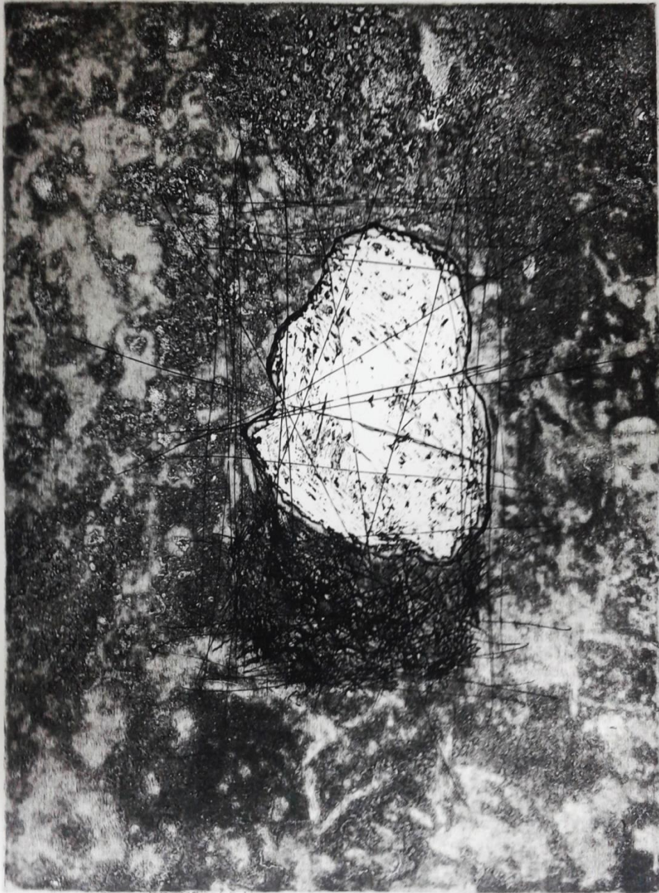
Prilog 4. - Treći rad