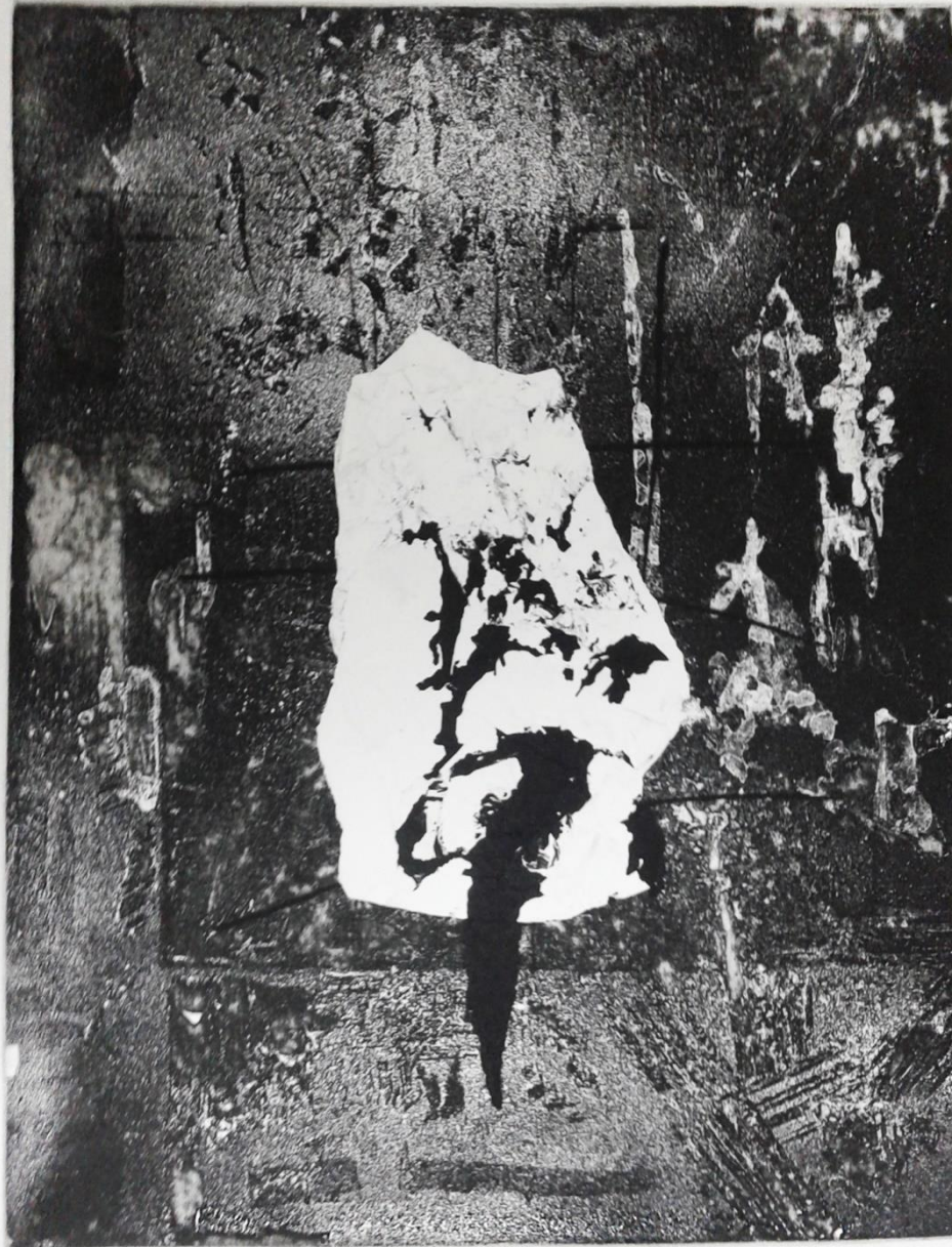
Prilog 5. - Četvrti rad