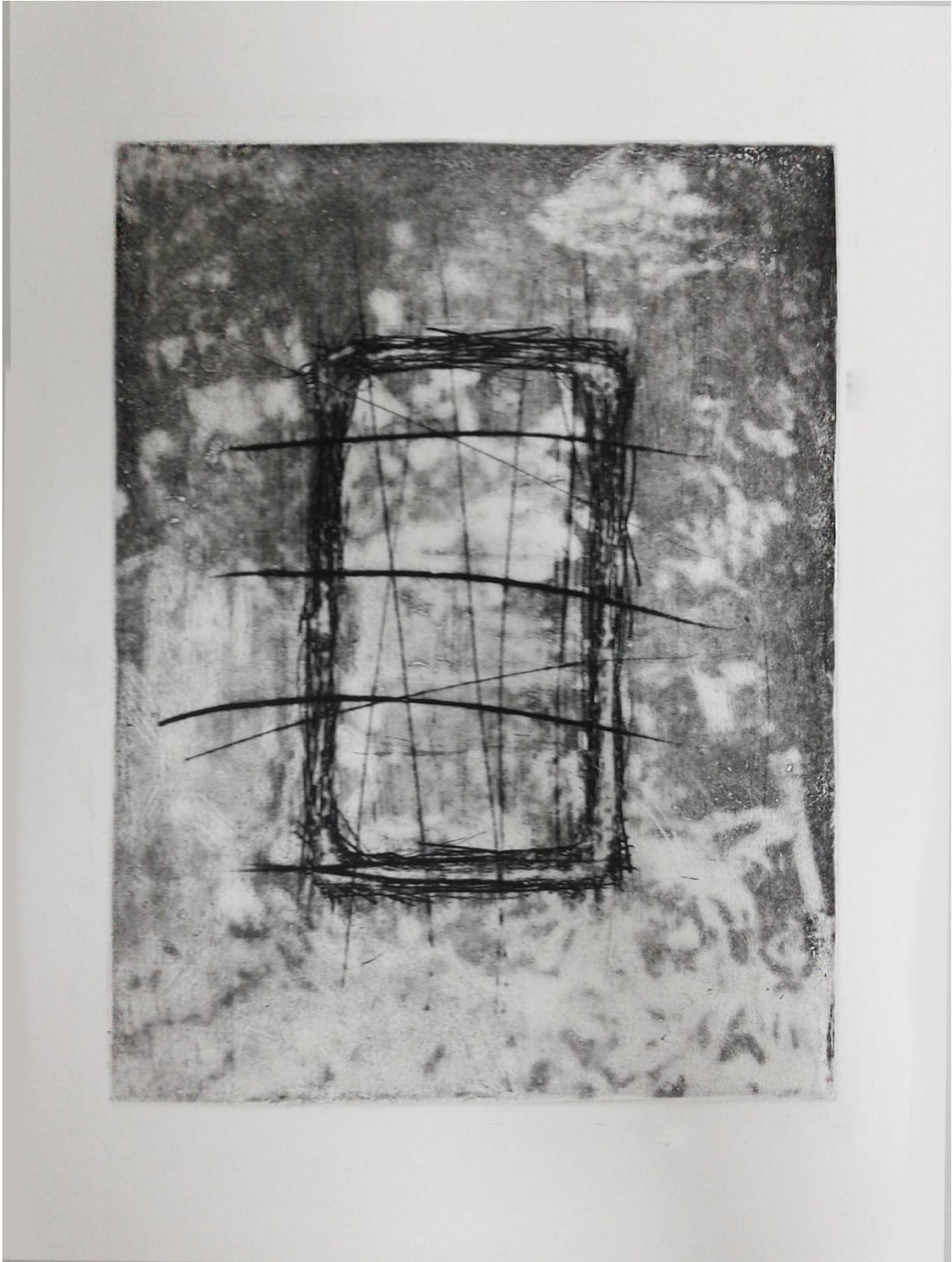
Prilog 3. - Drugi rad