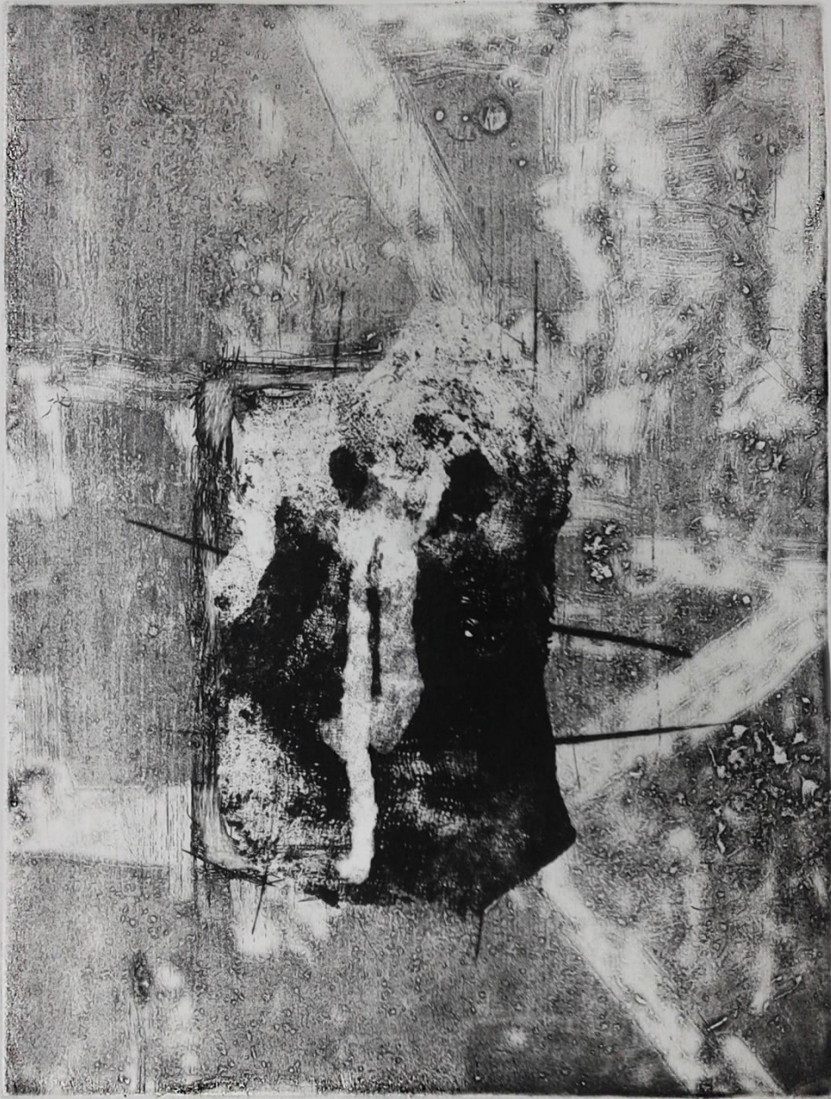
Prilog 2. - Prvi rad