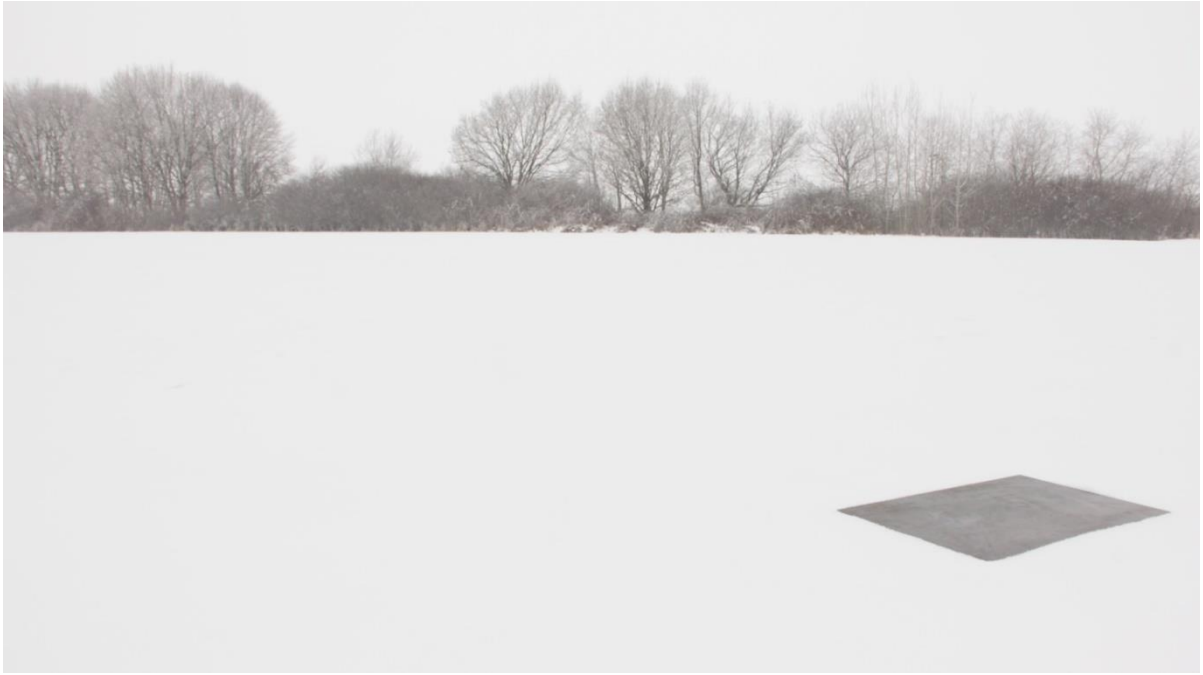
Slika 1. Željezna matrica ostavljena na polju, siječanj 2017.