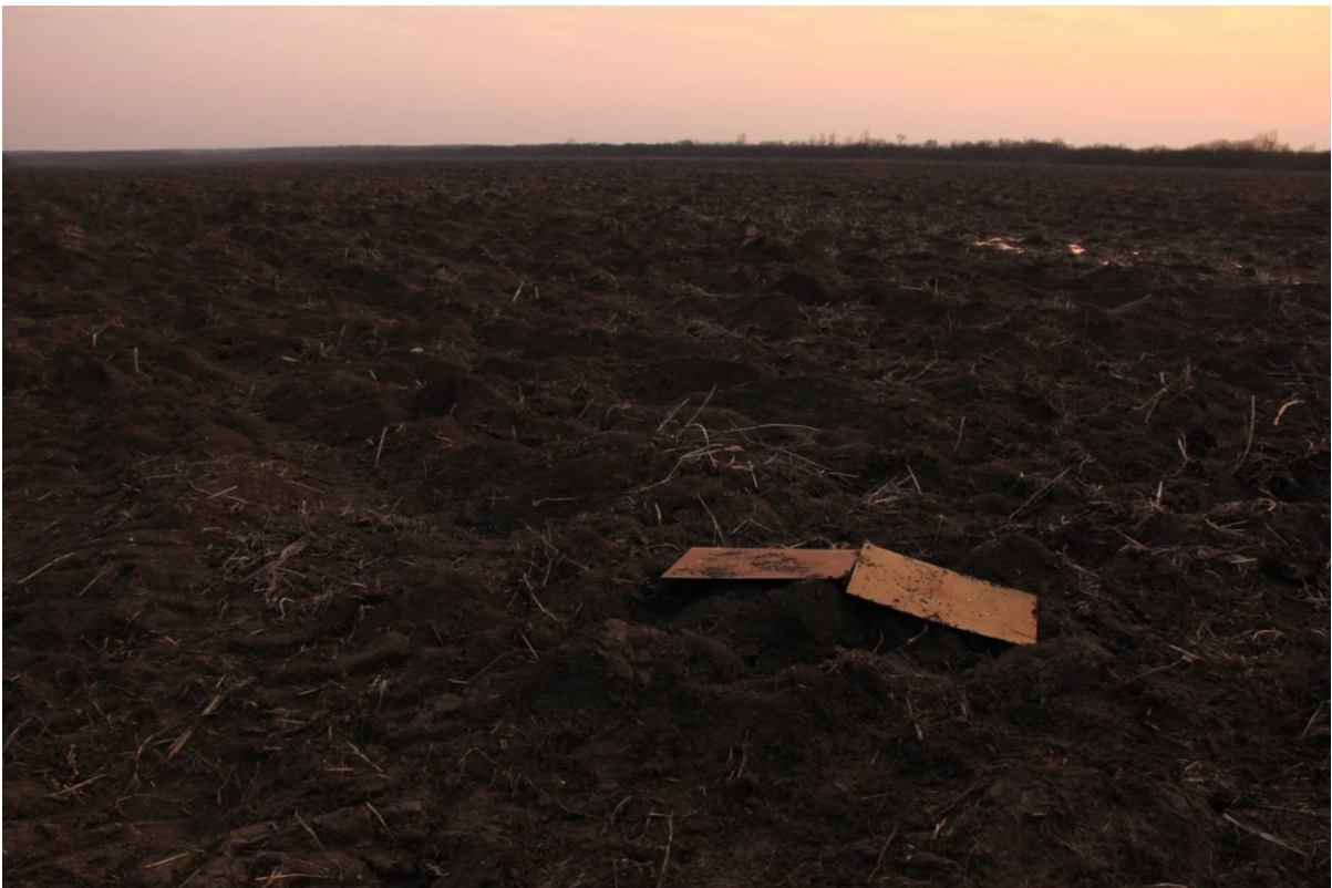
Slika 2. Utisak polja u grafičku ploču premazanu mekim voskom, siječanj 2017.