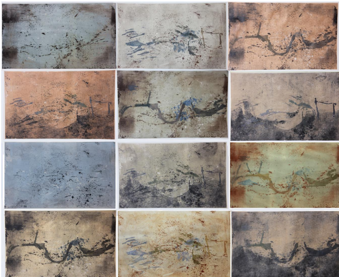
Slika 5. Field recordings – dvanaest otisaka aranžiranih u poliptih

Vizualni prikaz u otiscima možemo interpretirati kao prostor negativa. Onaj koji ostaje skriven svakodnevnom pogledu. Dokumentacija rada uključivala je fotografiju i video snimak s pripadajućim zvukom. Zvuk s lokacije bit će prezentiran prilikom obrane diplomskog rada uz grafičku ediciju kao ekvivalent vizualnom.