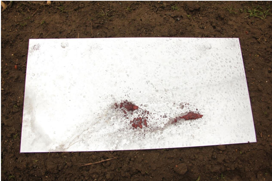
Slika 4. Rezervaš kompozicija od nađenih elemenata, veljača 2017.