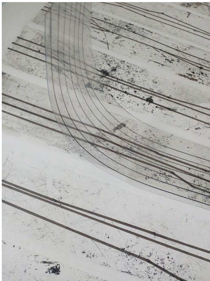
Slika 6. Transparentna folija s linijama za identifikaciju tonova

Nastaje grafička notacija – otisak “Partiture for three voices“ (120 x 140 cm) koji sadržava 24 matrice, svaka matrica vrijedi za 2 takta, što znači da glazbena kompozicija ukupno ima 48 taktova. Linije predstavljaju tri glasa, a distance među njima intervale između tonova. Vokalni raspon kreće se od tona a do e2 , koje se uz pomoć transparentnog notnog crtovlja može identificirati. Slika 6. prikazuje transparentnu foliju sa sedam linija, koje znače raspon u kojem se glazbena kompozicija kreće. Točnije kada je vokal u tonu a, od početka matrice do tona dužina je 4 cm. Zatim kada vokal kreće u ton h, dužina bi se povećala na 4,5 cm. Kada bi se mjenjala visina tona, u toj visini (npr. tona h) bih pronašla dominantnu točku u otisku koju je zemlja utisnula, zatim bih povukla liniju koja bi spajala prethodni ton i prethodnu točku sa slijedećima. Prema tome visine tonova (u odnosu na početak matrice) spajam u dominantnim točkama koje nađem u tim visinama i dobivam jedinstveni “pattern“ koji u vizualnom označava ujedno zvuk triju vokala i zemlju.