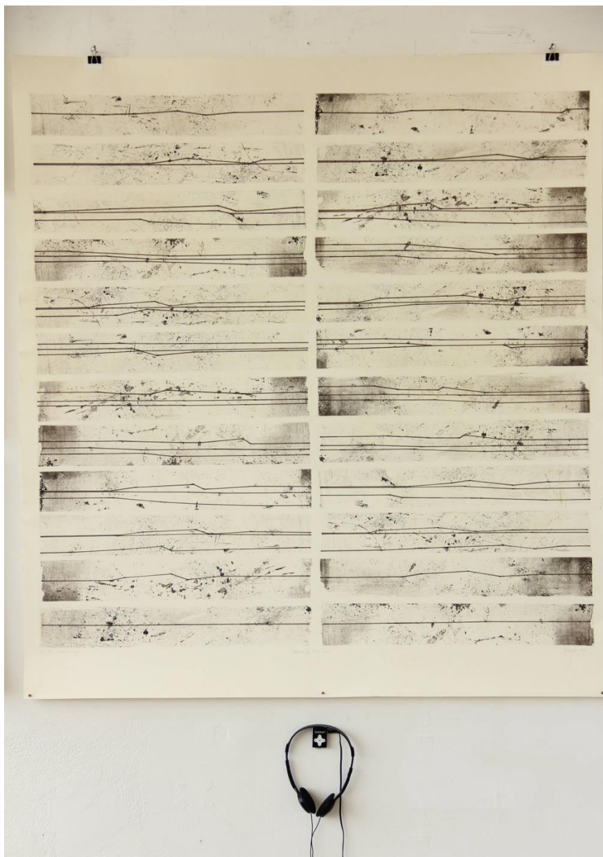
Slika 7. Partiture for three voices – grafička notacija