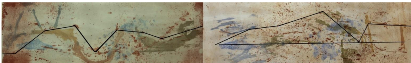
Slika 5. Analiza prisutnih apstraktnih usmjerenja

Nakon završene grafičke edicije uslijedila je analiza dominantnih vizualnih kretnji u otiscima. Prisutni oblici u plohama kreću se od centra formata tijekom prema dolje te se u konačnici vraćaju na gotovo istu dužinu u odnosu na početak formata. Linijskim ucrtavanjem kompozicijskih osi apstraktnih oblika dobivam dominantnu kretnju koja podsjeća na stilizirani prikaz vala – krivulju (Slika 5.). Slična se kompozicija provlači kroz sve otiske. Zatim u razgovoru sa Ksenijom postavljamo nekoliko zadanih okvira za glazbenu kompoziciju koje strukturalno možemo korelirati s prethodno nastalim vizualnim kompozicijama. Složile smo se da će glazbena kompozicija biti minimalistička, repetitivna i bez teksta. Ksenija je zatim napisala glazbenu partituru za tri vokala, s dominantnom melodijom koja u svojim izmjenama tonova sadržava krivulju. Tri vokala odgovaraju trima fizikalnim/kemijskim procesima pomoću kojih je nastala grafička edicija.