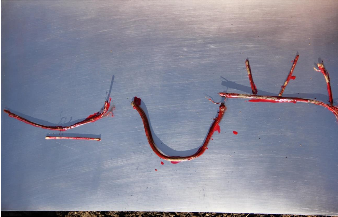
Slika 3. Aluminijska matrica ostavljena na kiši, veljača 2017.