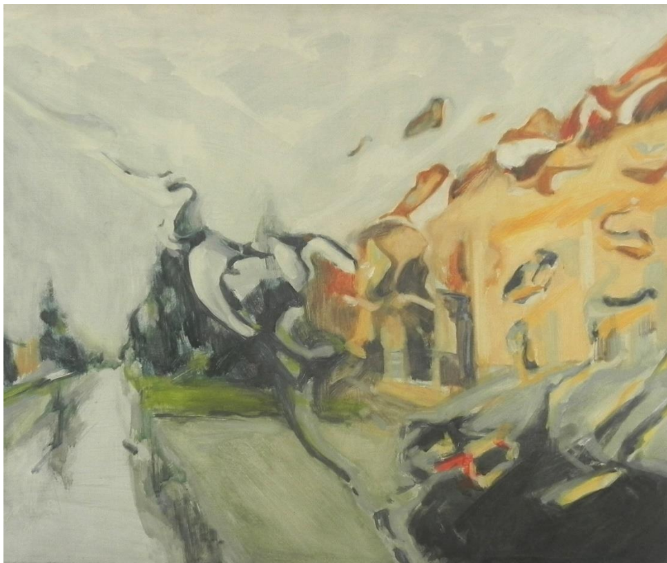
Slika 2. Otkrivati (eng. Reveal), ulje na papiru, 2014.