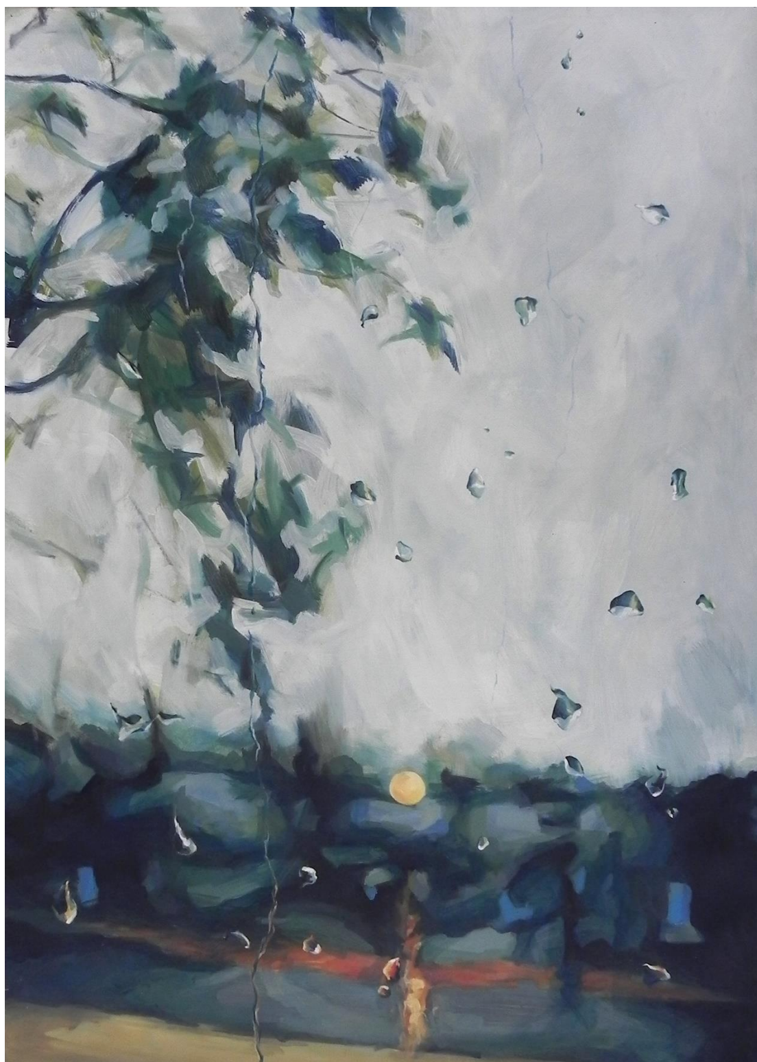
Slika 1. Osloboditi (eng. Release), ulje na papiru, 2013.