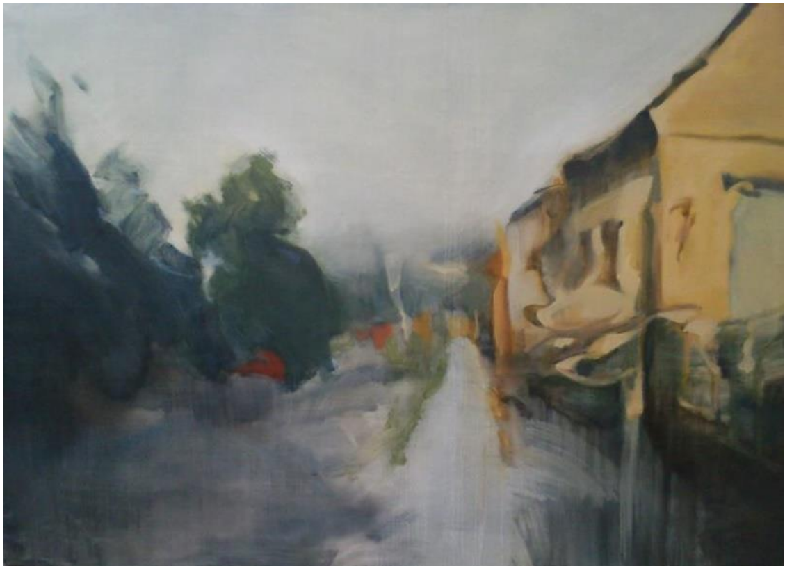
Slika 5. Neograničen (eng. Limitless), ulje na papiru, 2014.