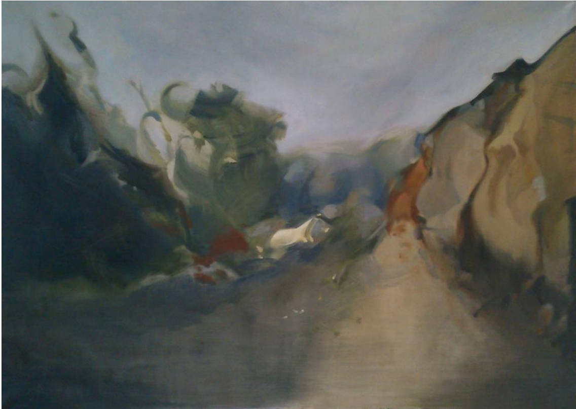
Slika 4. Vodoriga (eng. Gargoyle), ulje na papiru, 2014.