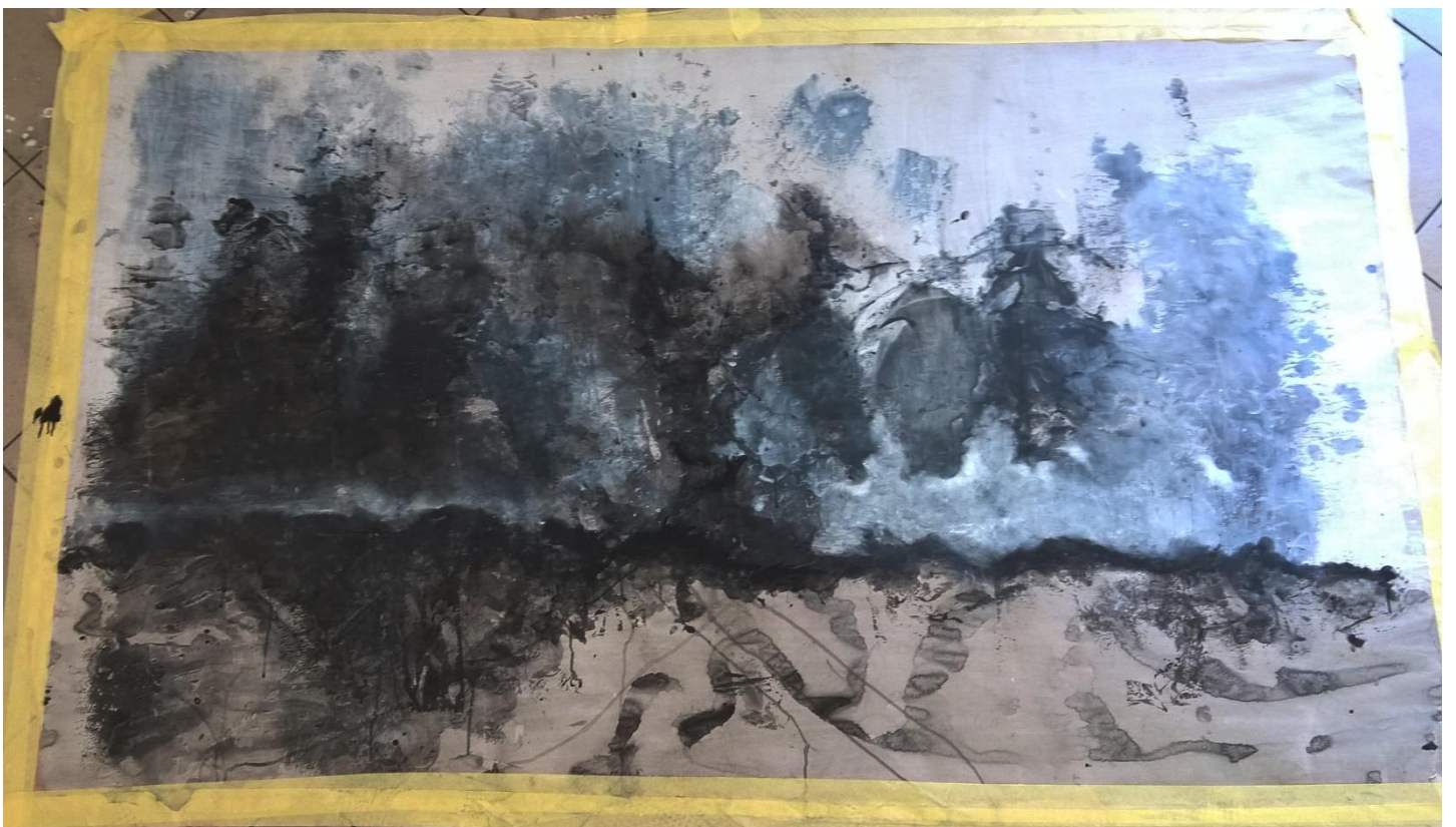
Slika IV Druga faza rada