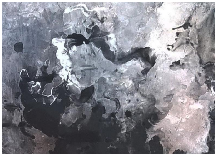
Slika III Detalj