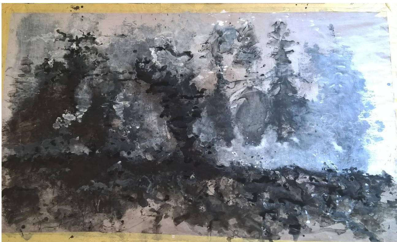
Slika V Treća faza rada

Ugljen i kreda iza sebe ostavljaju prašan i magličast trag što postiže dobar kontrast u odnosu na teške oblike koje stvara akril.