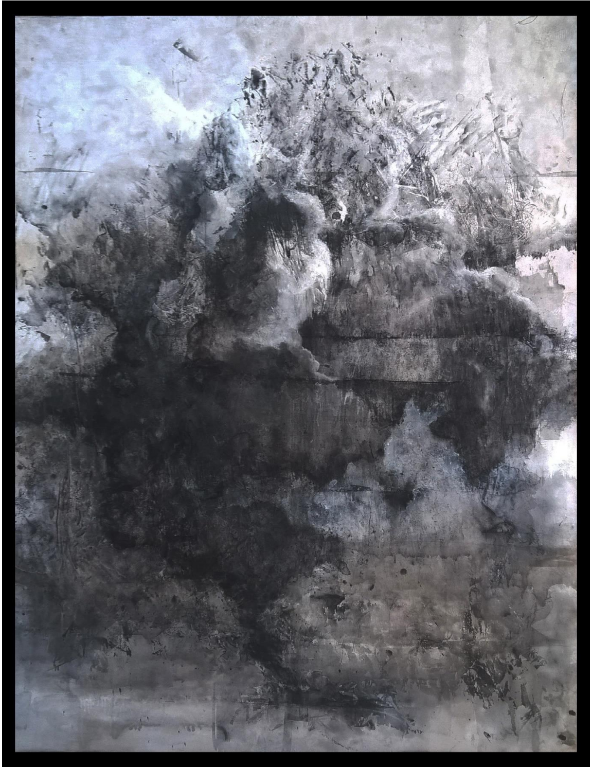
Gotovi rad 2