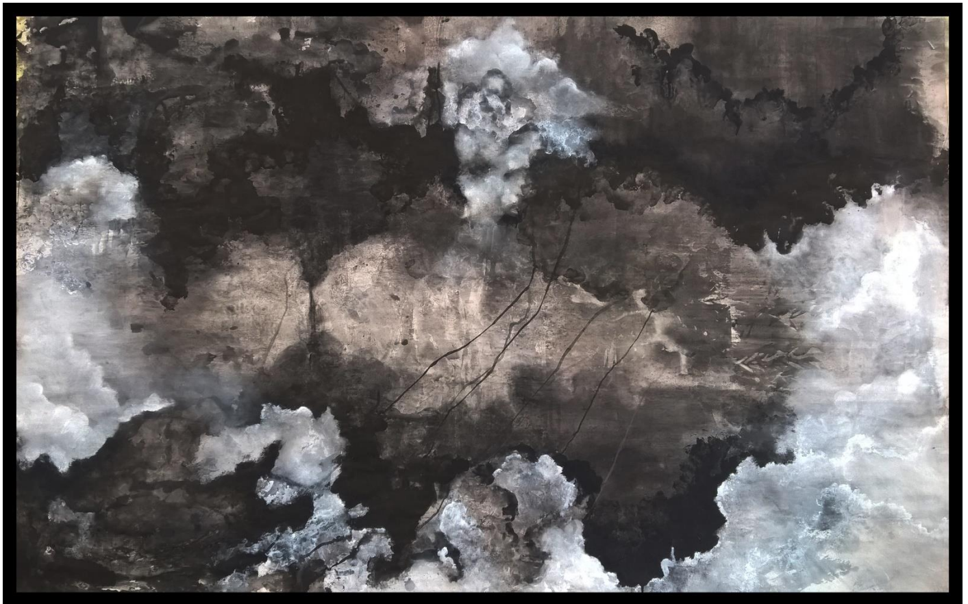
Gotovi rad 3