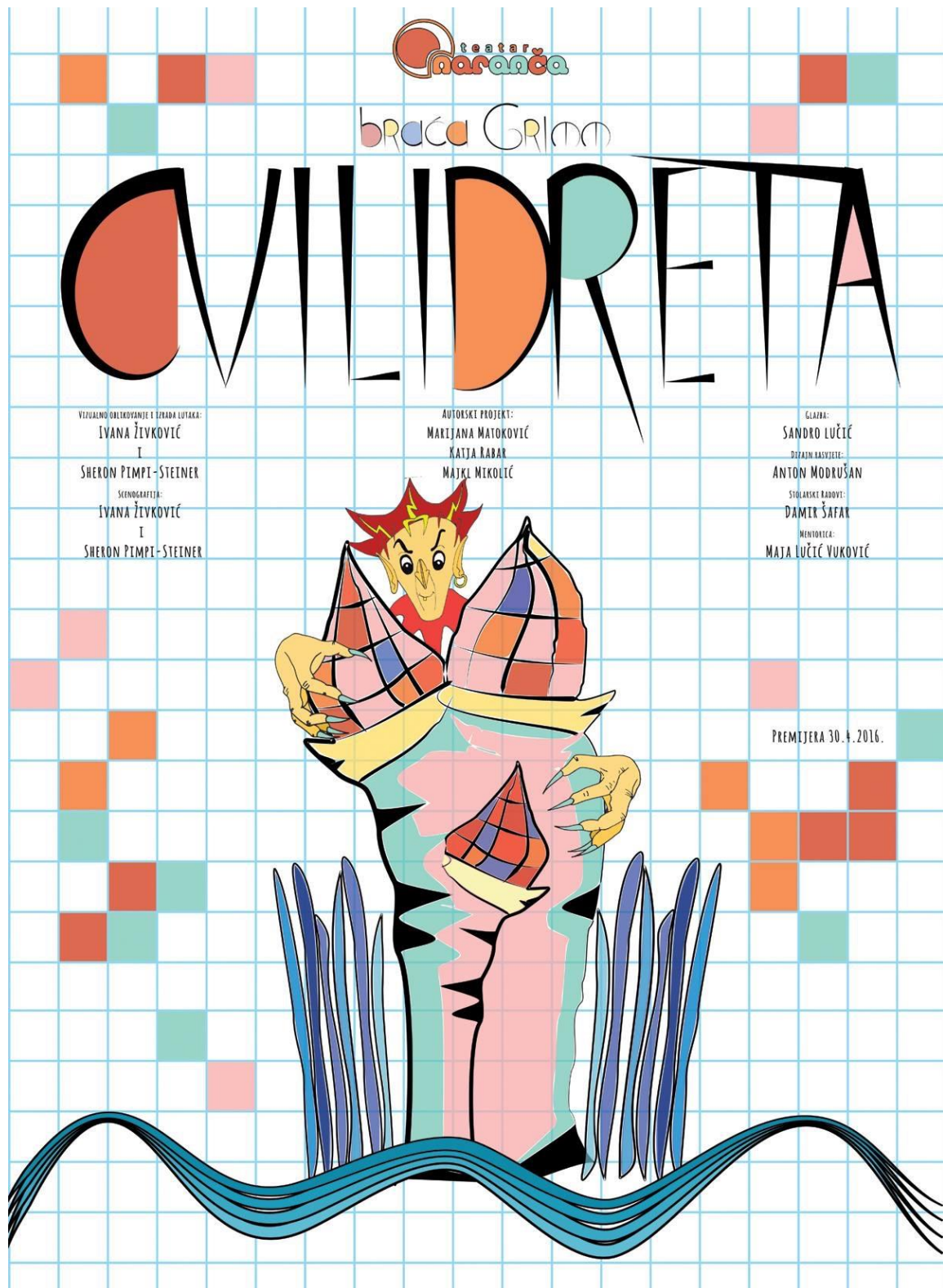
Slika 1: Plakat predstave Cvilidreta