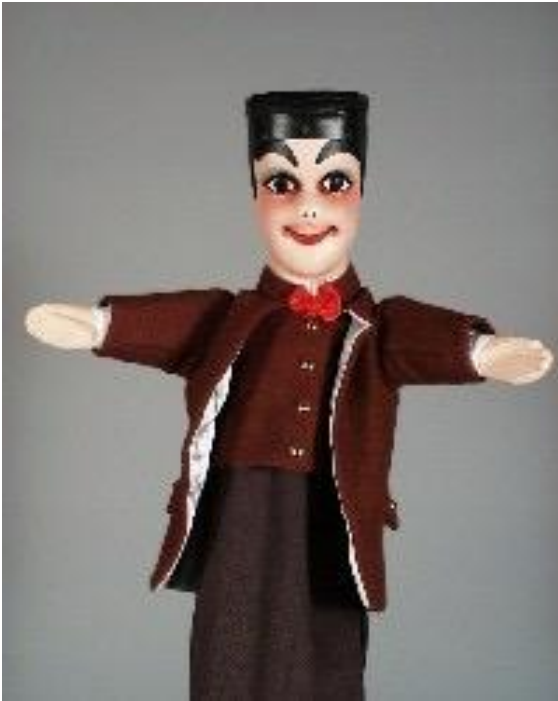
Slika 4: Guignol

Lik Guignol je bio izuzetno popularan kod publike. U Hrvatskoj koristimo riječ ginjol kao sinonim za ručne lutke, iako je termin ručne lutke širi pojam od same tehnike ginjola. Stoga, kod imenovanja treba razlikovati vrstu tehnike od imena lika.