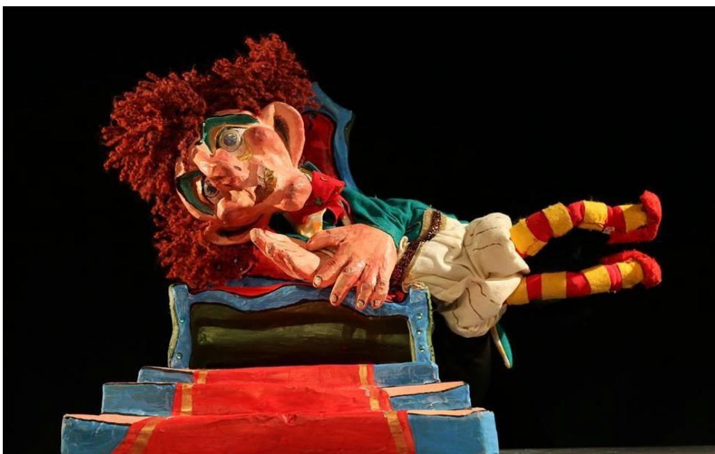
Slika 5: Cvilidreta

Lutka Cvilidrete je visoka oko 40cm i ljudskog je oblika. Odabir te veličine odgovara veličini ruke koja animira i udaljenosti publike od scene. Prema mjerenjima, lutke te veličine su vidljive do zadnjeg reda u dvorani u Naranči. Cvilidreta ima crvenu kuštravu kosu. Crvenom bojom smo htjeli naznačiti da se radi o zlikovcu, ali opet šarmantnom zlikovcu i zato ima kuštravu kosu. Ima također crvenu mašnu i prugastu majicu sa bijelo-žutim prugama. Preko toga je zeleni frak čime naznačujemo da se radi o slugi, a opet je u kontrastu s bojom kose. Nadalje, ima svijetle pumperice, s tankim uzorkom zlatne boje. Kako se radi o vremenskom periodu kada su vladali kraljevi, ostali smo stilski dosljedni odabirom fraka i pumperica. Noge su presvučene crveno-žutom tkaninom postavljeno vodoravno prugasto. Prugicama na majici i na nogama ističe se njegova ludost i šarenilo, ali opet sve je vrlo uredno jer ipak radi se o slugi koji služi na dvoru. Na nogama ima crvene cipelice u špic koje se pokreću s dva prsta tako da stvarno izgleda da radi male korake. Glava mu je disproporcionalna s ostatkom tijela, a na glavi se najviše ističe nos. Takva likovnost pomogla mi je u kreiranju glasa i karaktera. Osnovne boje Cvilidrete su crvena, zelena i žuta.